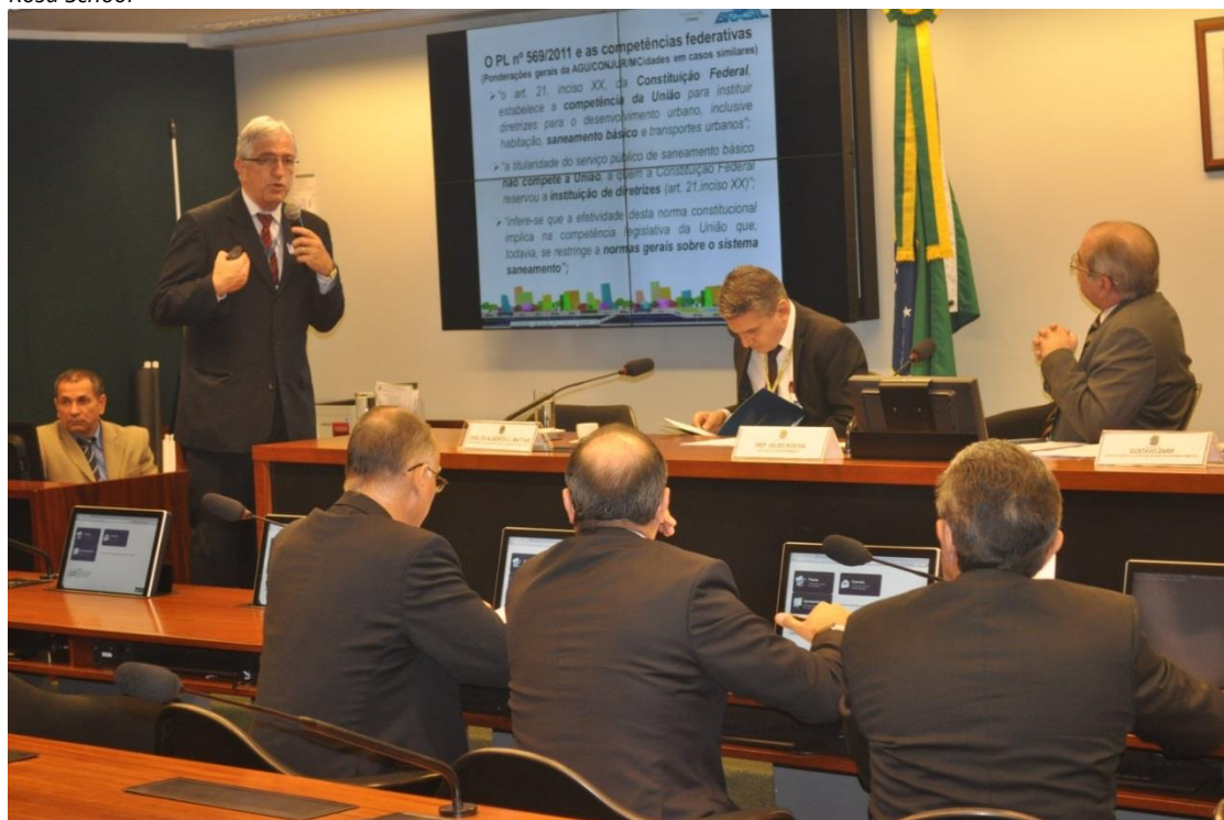
Plenário da Audiência Pública.