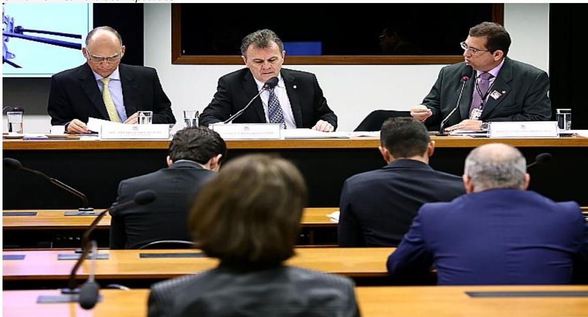
Plenário da Audiência Pública