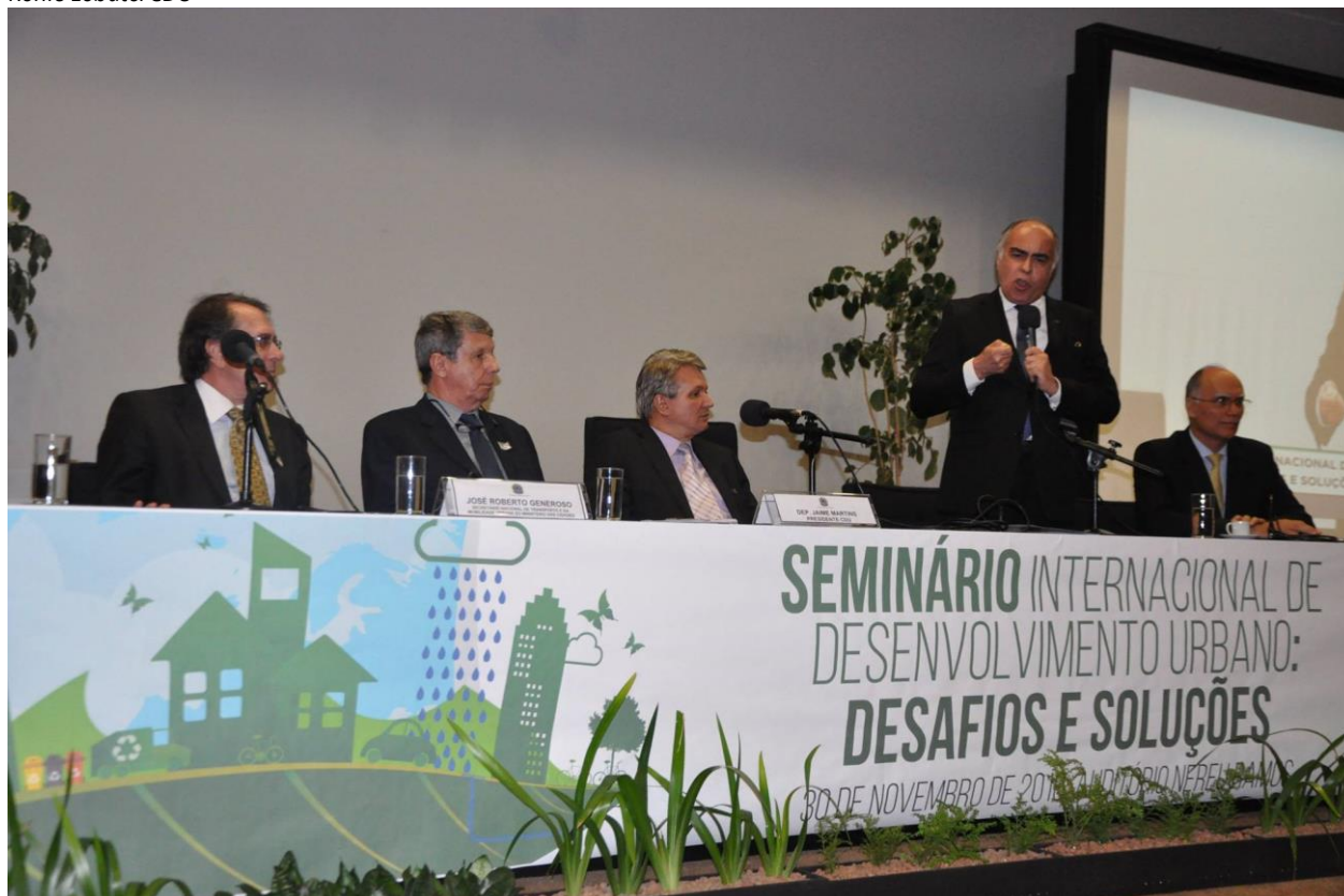
Seminário Internacional de Desenvolvimento Urbano