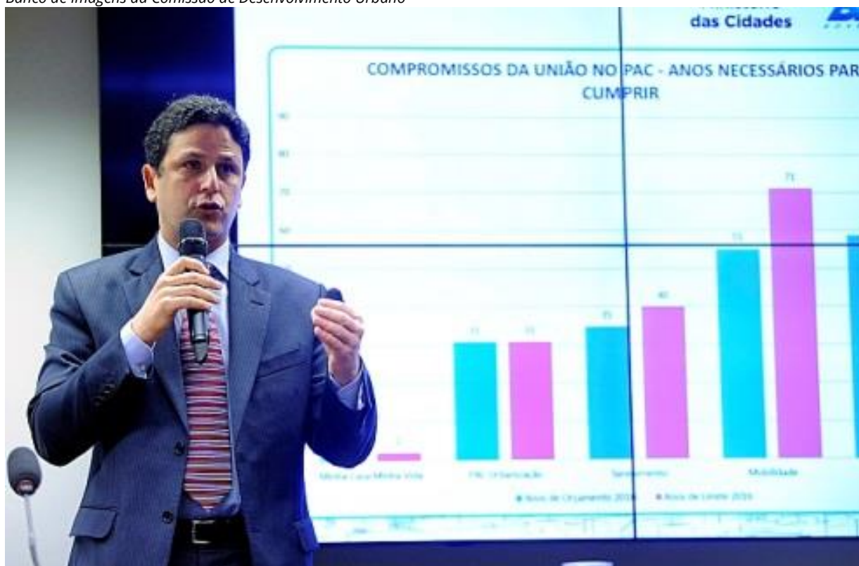
Ministro das Cidades, Bruno Araújo.