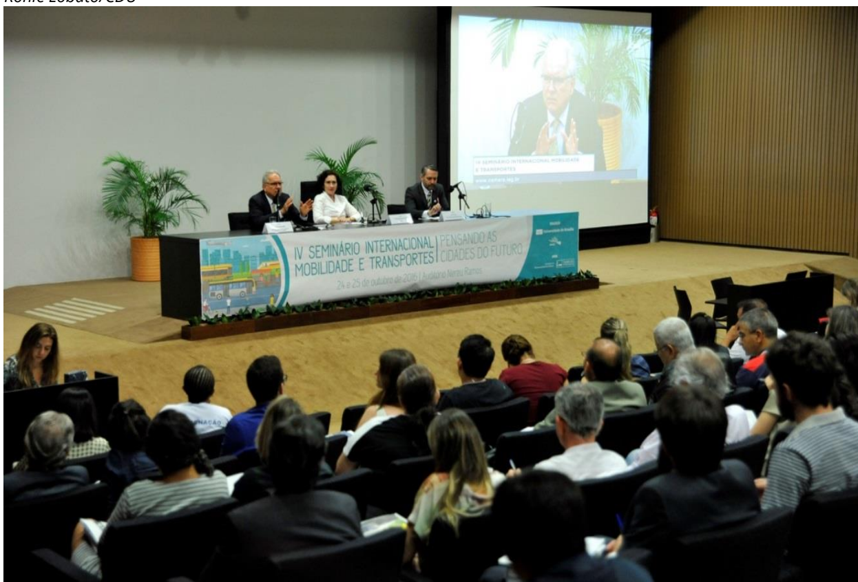
IV Seminário Internacional Mobilidade e Transportes