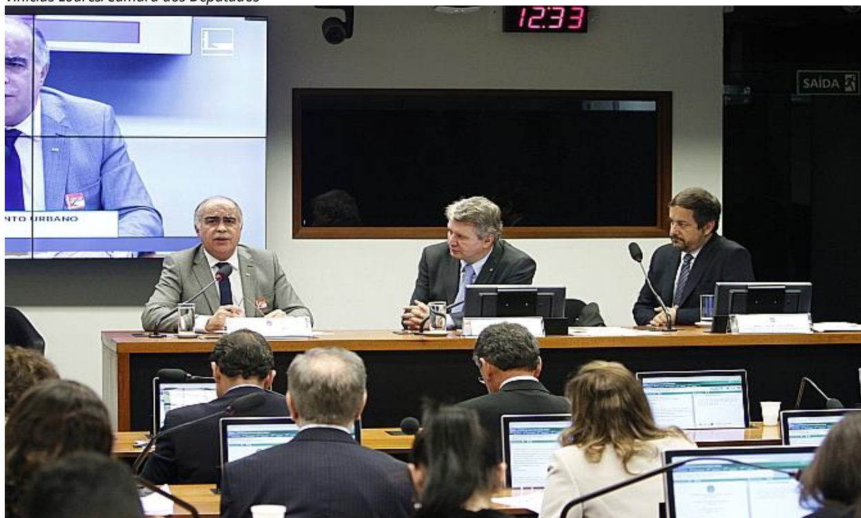
Plenário da Audiência Pública