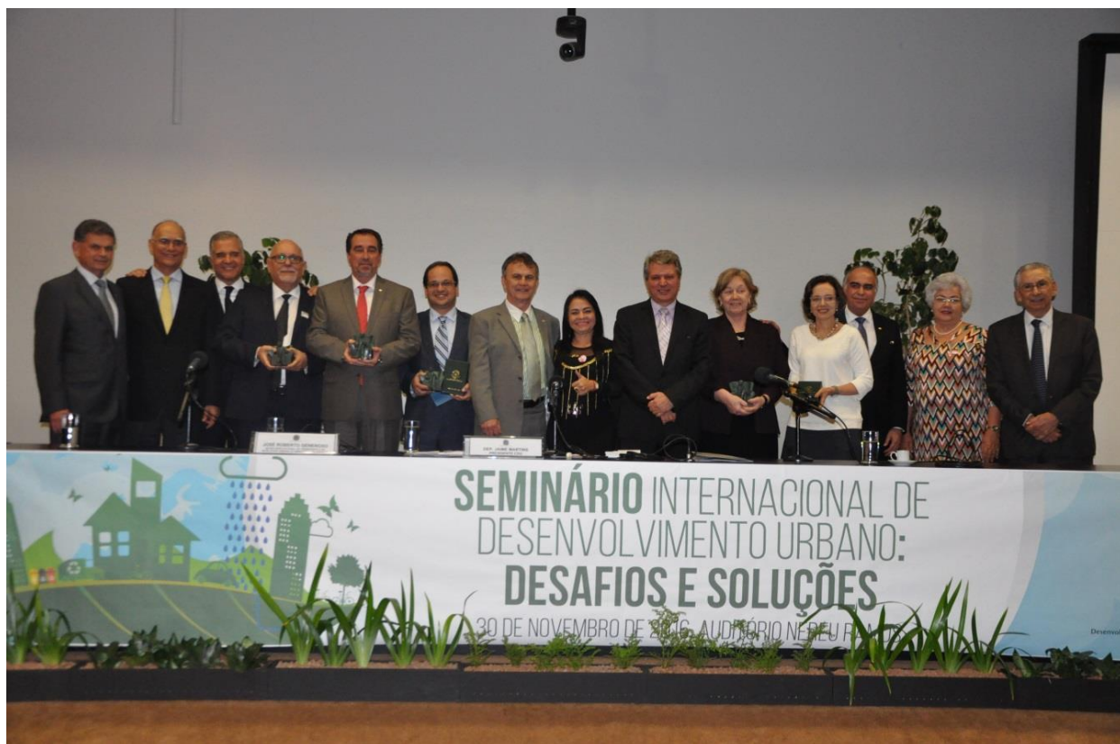
Solenidade de entrega da 2ª edição do Prêmio Lúcio Costa, Auditório Nereu Ramos, Câmara dos Deputados