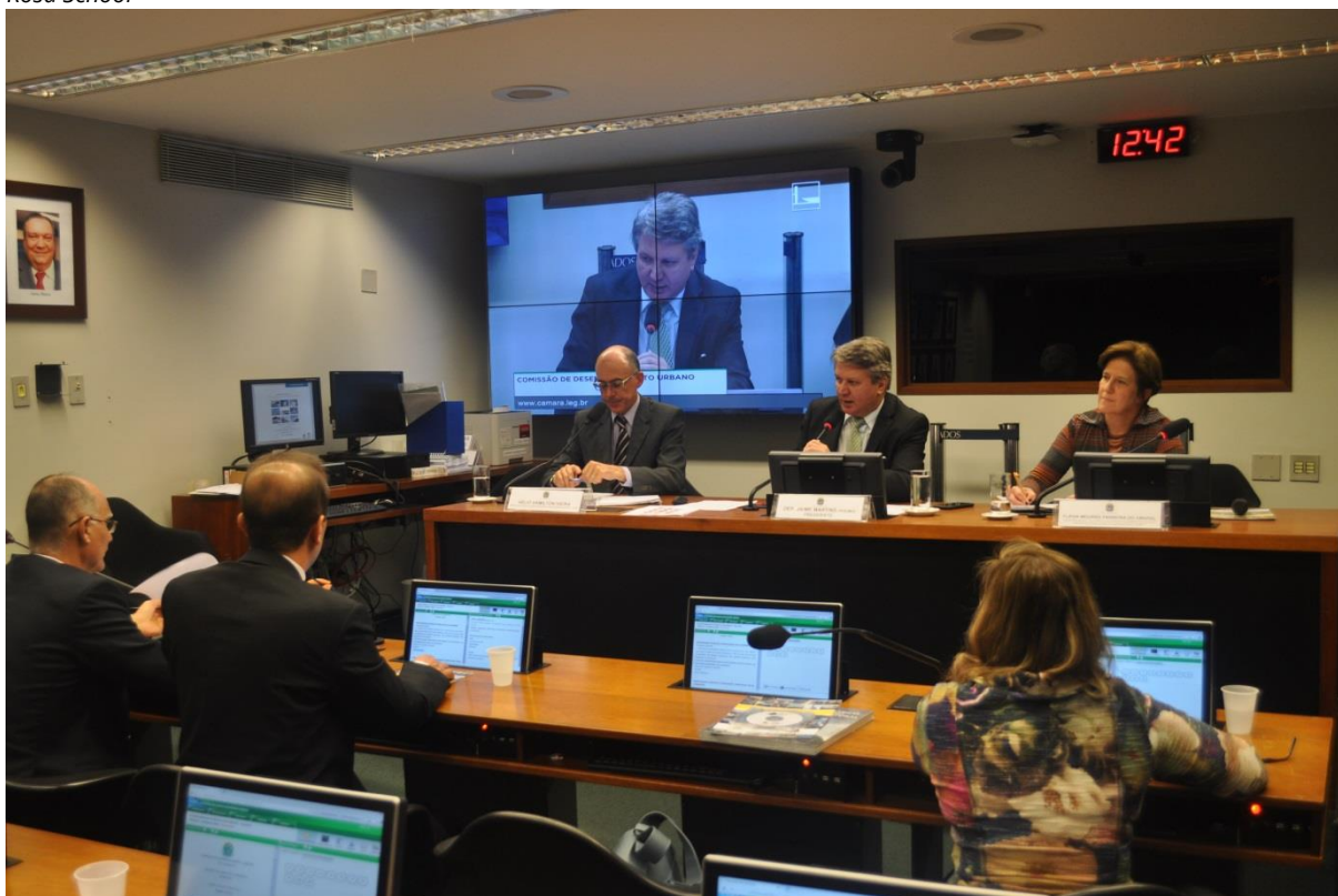
Regiões Metropolitanas de Belo Horizonte e da Baixada Santista foram temas da reunião