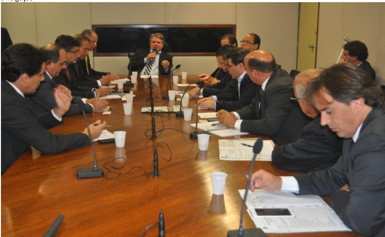
Parlamentares da CDU discutem aperfeiçoamento na legislação