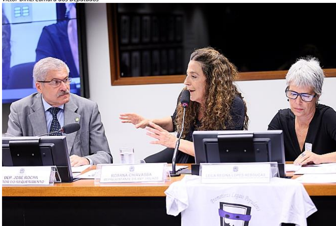
Representante da ANP Trilhos externando a posição daquela Associação sobre o tema