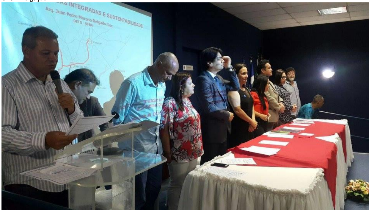
Plenário do Seminário na cidade de Lauro de Freitas/BA