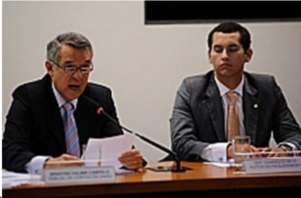
Exmo. Sr. Valmir Campelo , Ministro do Tribunal de Contas da União – TCU.