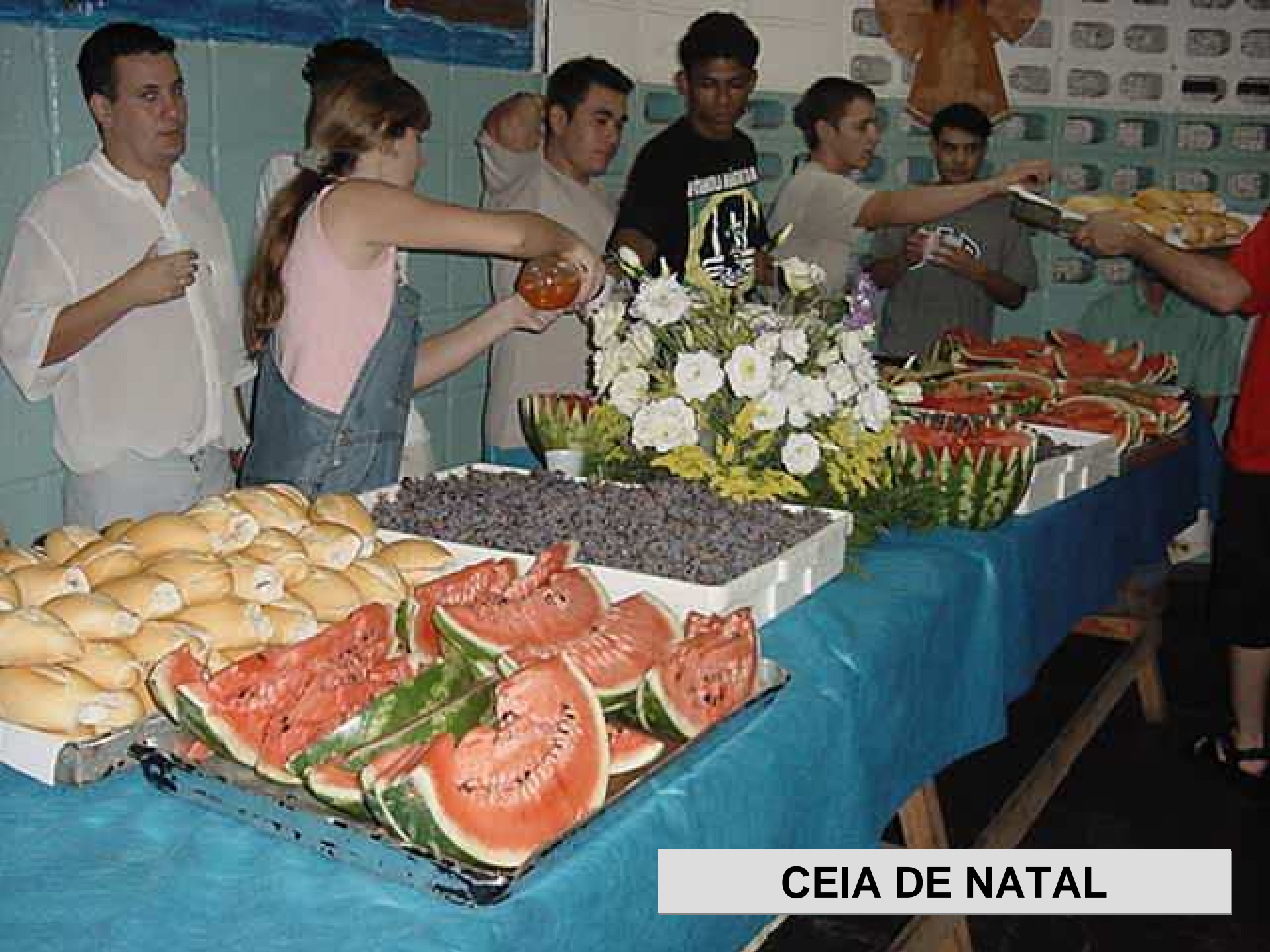
CEIA DE NATAL