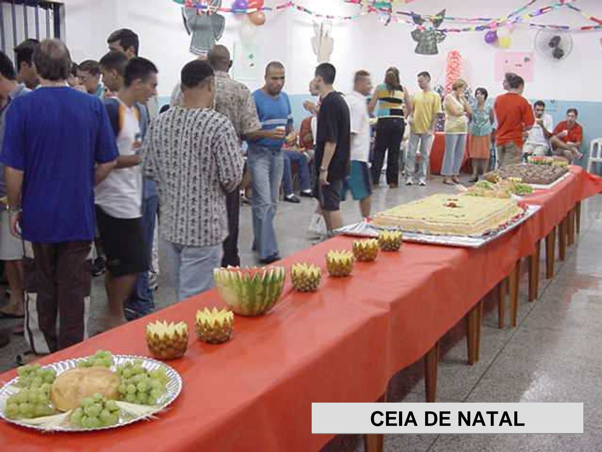
CEIA DE NATAL