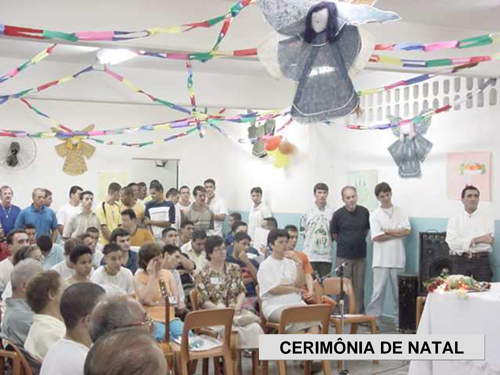
CERIMÔNIA DE NATAL