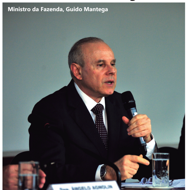
Ministro da Fazenda, Guido Mantega

O ministro da Fazenda, Guido Mantega, em audiência pública (27/6) na Câmara rebateu críticas à política econômica do Governo e reforçou sua confiança na solidez da economia brasileira. A audiência envolveu quatro comissões da Casa. Pela CDEIC, requereu o deputado Mandetta (DEM/MS).