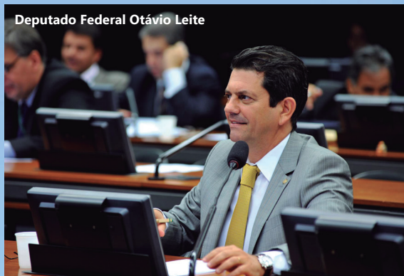
Deputado Federal Otávio Leite

De acordo com o autor do projeto, é preciso investir com urgência na nova economia de baixo carbono, que já é percebida como única alternativa possível para gerar prosperidade em um planeta cada vez mais deteriorado por empresas poluentes.