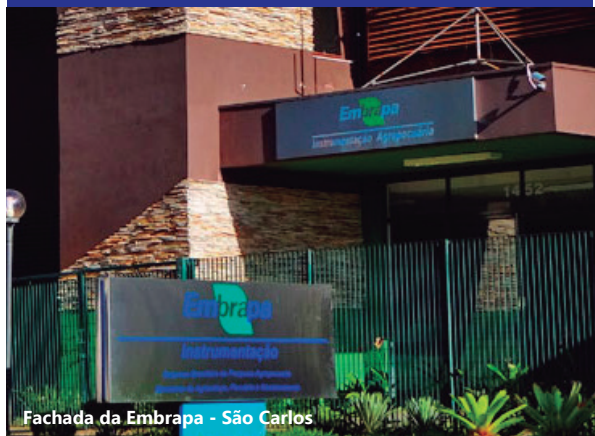
Fachada da Embrapa - São Carlos

São Carlos, cidade do interior de São Paulo, avança como modelo de pesquisa e tecnologia. O ambiente universitário do município paulista é voltado para pesquisas aplicadas e à formação de acadêmicos empreendedores.