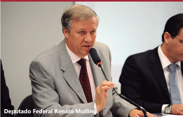
Deputado Federal Renato Molling

O programa do governo federal termina no final de 2013. A representante do Ministério da Fazenda na audiência afirmou que a posição do órgão é contrária à renovação porque o momento do governo federal é de restrição fiscal.