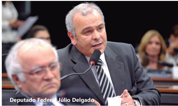
Deputado Federal Júlio Delgado

Nesse sentido, o relator do projeto, deputado Júlio Delgado (PSB-MG), entende que é necessário a remoção de qualquer tipo de entrave regulatório que impeçam, por ação ou omissão, que as preferências fixadas na legislação possam ser exercidas na plenitude.