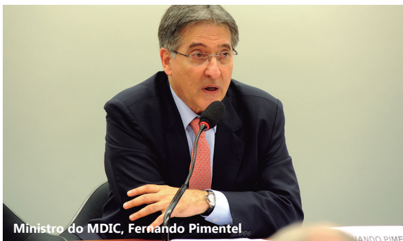
Ministro do MDIC, Fernando Pimentel

No mesmo evento, o deputado Carlos Roberto (PSDB/SP) questionou o ministro Pimentel sobre a redução da participação da indústria no PIB brasileiro. O deputado foi um dos autores do requerimento que