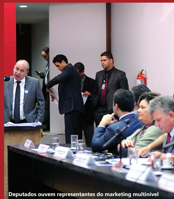
Deputados ouvem representantes do marketing multinível

Para aprofundar as discussões com especialistas que estudam o marketing multinível, foi promovido ainda um seminário (6/11) em que se destacou ainda o trabalho do deputado Acelino Popó (PRB-BA), presidente da Frente Parlamentar que defende a atividade e, que recém-egresso à subcomissão, presidiu o evento.