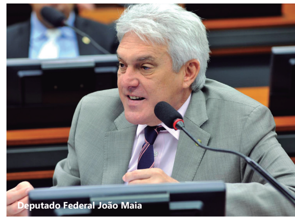
Deputado Federal João Maia

A capitalização de empresas sem a obrigação de garantias reais foi destacada pelo relator, deputado Valdivino Oliveira (PSDB/GO). De acordo com o parlamentar, os bancos levam em conta a garantia e a reciprocidade na abertura de crédito. O mérito do projeto está no crédito que se dá ao negócio, sem a necessidade de recorrer à burocracia bancária.