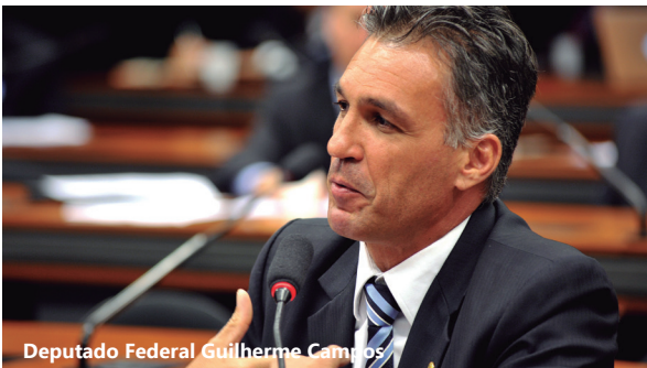
Deputado Federal Guilherme Campos

A determinação não se aplica a processo fiscalizatório individualizado, licitações e convênios.