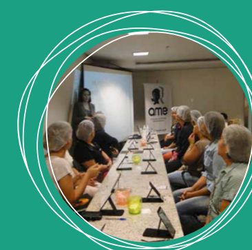
Curso de Maquiagem Profissional