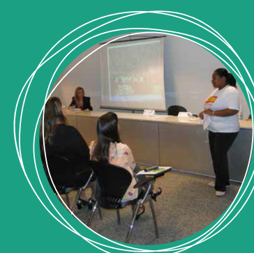
PEC das Empregadas Domésticas