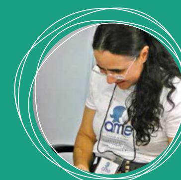
Curso de Bordado