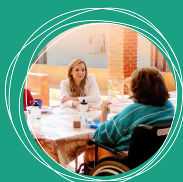
Curso de cuidado ao Idoso