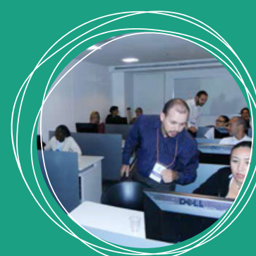
Curso de Informática