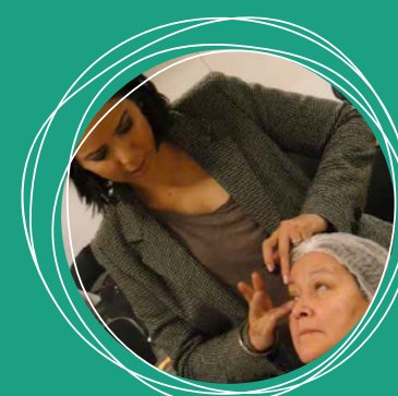
Curso de Maquiagem Profissional