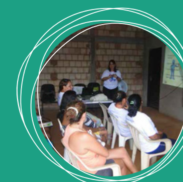
Oficina de Empreendedorismo do Curso de Bordado