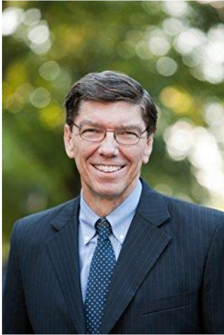
Clayton Christensen (1952-)