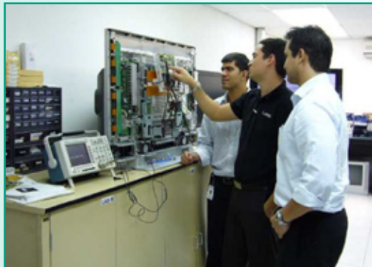
Treinamento in Loco