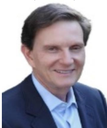
Marcelo Crivella (REPUBLIC/RJ)