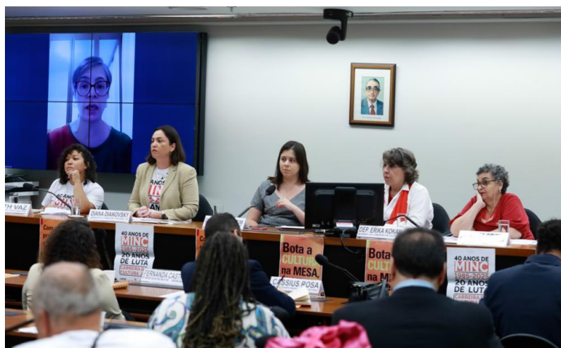
Deputada Sâmia Bomfim (Autora do Req. 99/2024 CASP) e convidados.