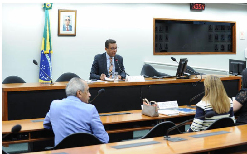
Dep. Otoni de Paula Autor do Req. 14/2024.