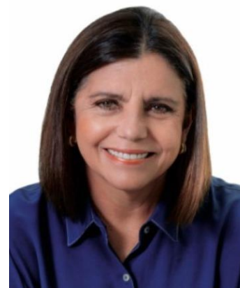
Roseana Sarney (MDB/MA)