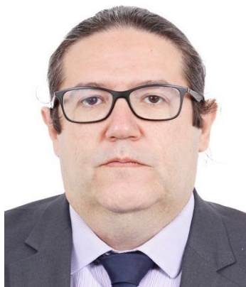
Tarcísio Motta (PSOL/RJ)