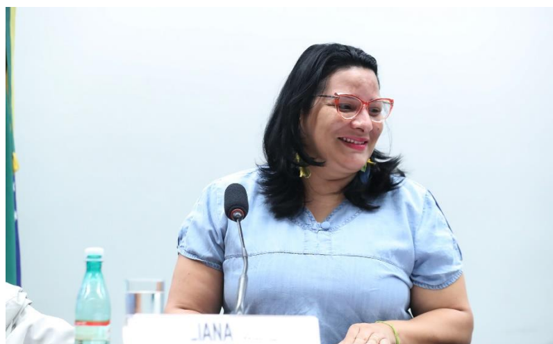
Dep. Juliana Cardoso Autora do Req. 21/2024.