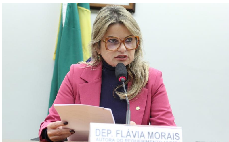
Dep. Flávia Moraes Autora do Req. 18/2024;