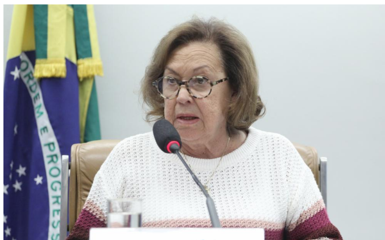
Dep. Lídice da Mata Autora do Req. 25/2024.