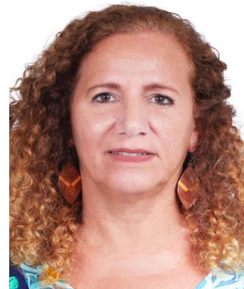
Jandira Feghali (PCdoB/RJ)