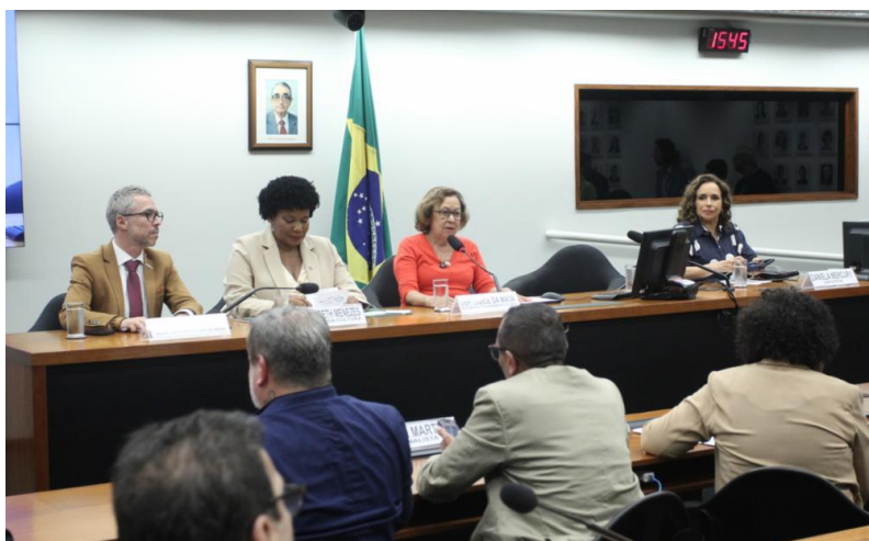
Deputada Lídice da Mata (Autora dos Reqs. 61/2023 e 37/2024) e convidados.