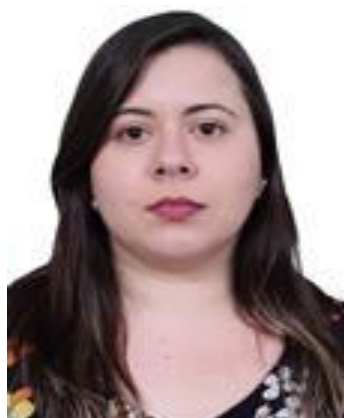
Sâmia Bomfim (PSOL/SP)