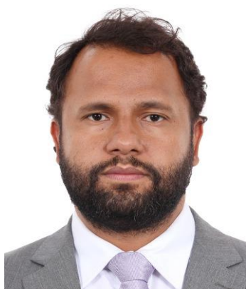
Pastor Henrique Vieira (PSOL/RJ)