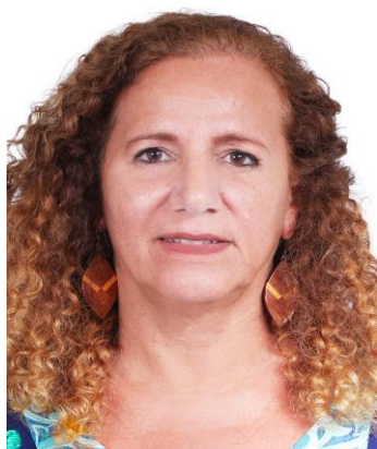
1º Vice-Presidente Jandira Feghali (PCdoB/RJ)