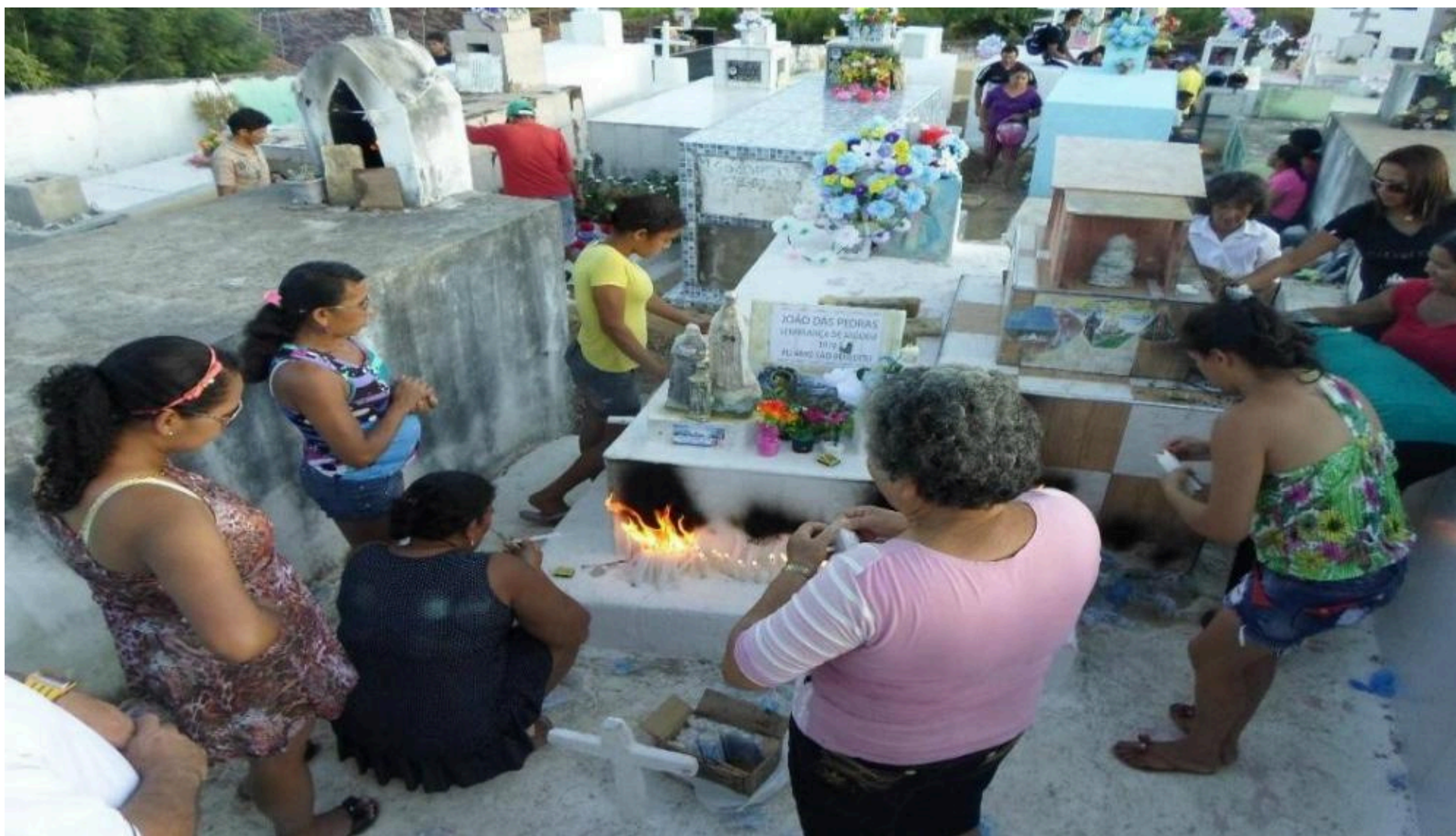
Túmulo de João das Pedras no Cemitério São Benedito, interior do Ceará.