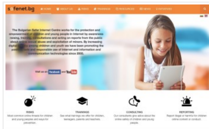
safenet.bg, Bulgaria's Safer Internet Centre, works to

It has been reported as real news here in the U.S. in recent weeks, just as it was earlier in eastern Europe, and what a dark, disrespectful message it sends about young people in any country. I'm talking about coverage of the so-called "Blue Whale suicide game" that started in Russia. And while even the term "fake news" seems to be morphing into something else now, this is the real, original version that's misleading and scaring parents.