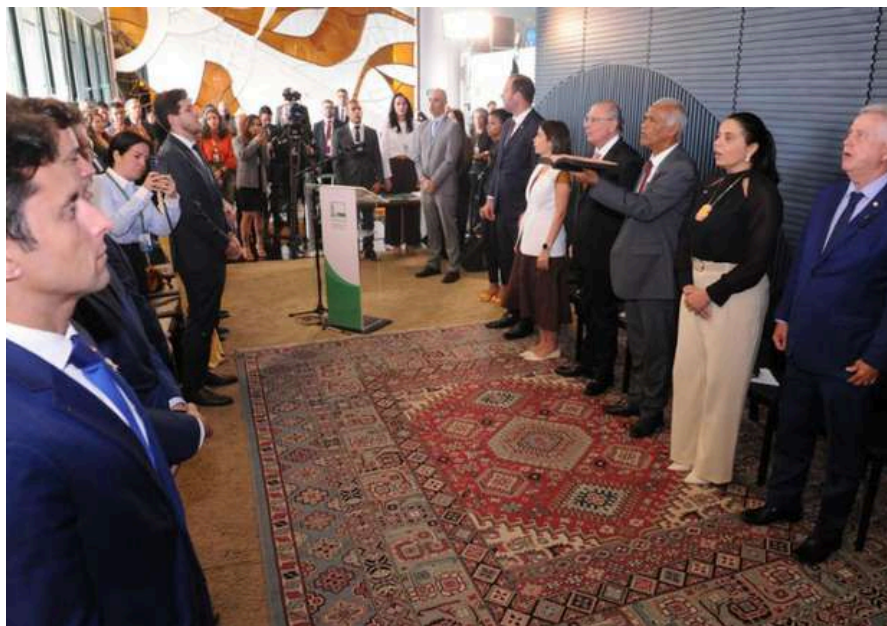
Renato Araújo / Câmara dos Deputados