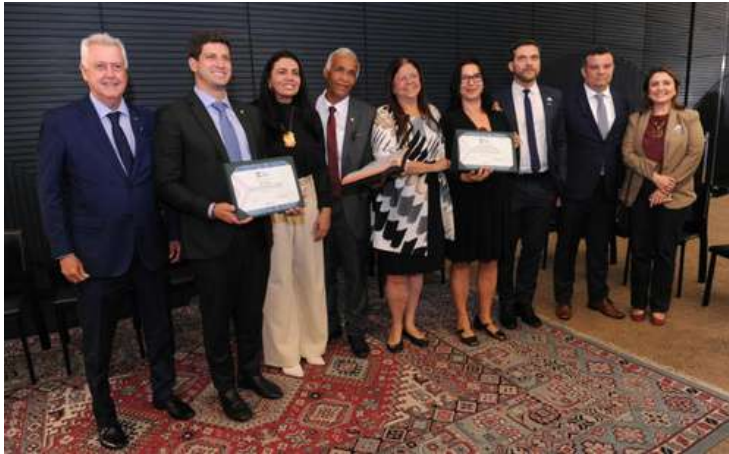
Renato Araújo / Câmara dos Deputados