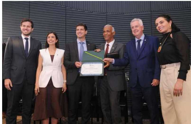
Renato Araújo / Câmara dos Deputados

Prefeito do Recife. Sua gestão prioriza inovação tecnológica, digitalização dos serviços públicos e políticas sociais para reduzir desigualdades. Avanços em sustentabilidade urbana, inclusão digital e modernização administrativa o destacam como exemplo dos valores que inspiraram a criação do prêmio.