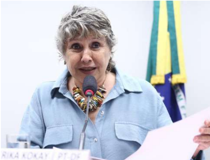
Dep. Erika Kokay | PT-DF