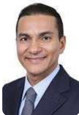
Marcos Pereira REPUBLICANOS - SP