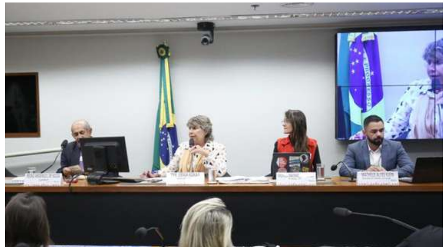
Dep. Erika Kokay | PT-DF