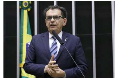
Dep. Reimont | PT-RJ