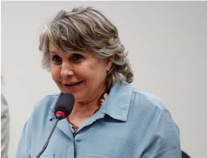
Dep. Erika Kokay | PT-DF