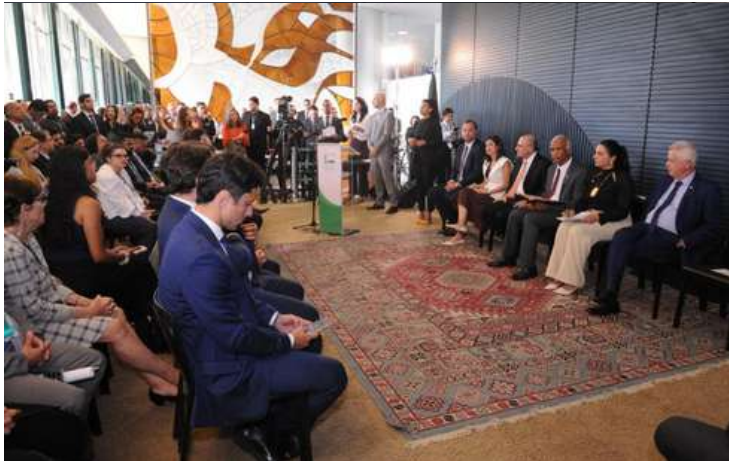
Renato Araújo / Câmara dos Deputados