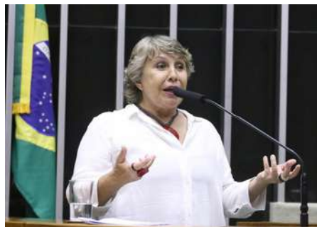
Dep. Erika Kokay | PT-DF