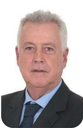
Rodrigo Rollemberg PSB-DF