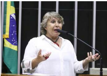
Dep. Erika Kokay | PT-DF