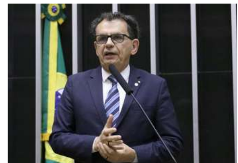
Dep. Reimont | PT-RJ