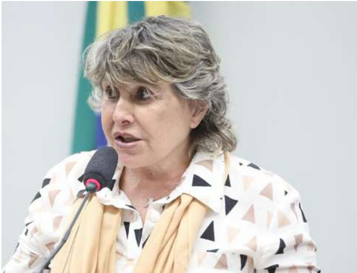
Dep. Erika Kokay | PT-DF