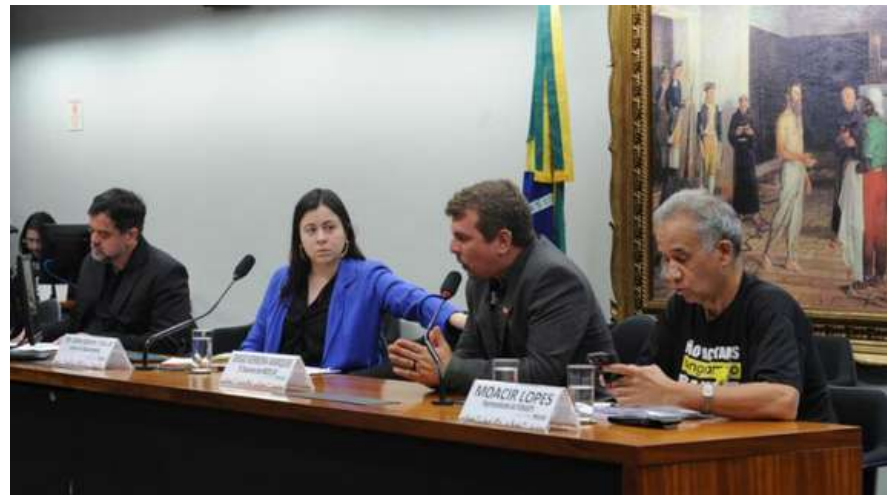
Dep. Sâmia Bomfim | PSOL-SP