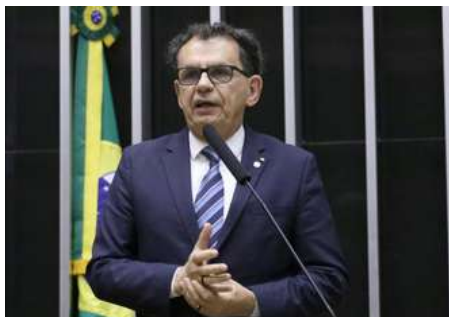
Dep. Reimont | PT-RJ