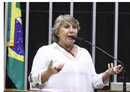
Dep. Erika Kokay | PT-DF