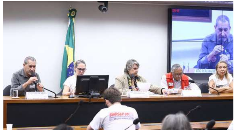
Dep. Erika Kokay | PT-DF