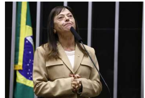
Dep. Alice Portugal | PCdoB-BA Vínicius Loures | Câmara dos Deputados