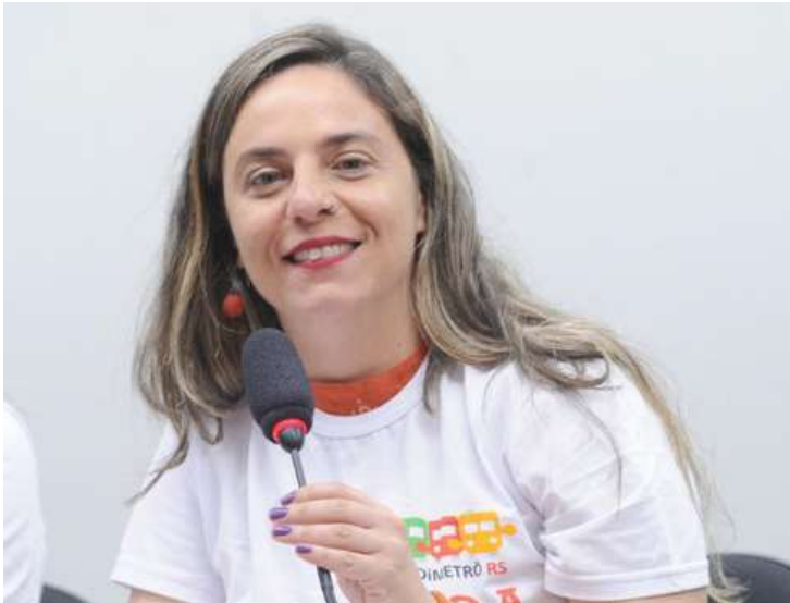
Dep. Fernanda Melchiona | PSOL-RS