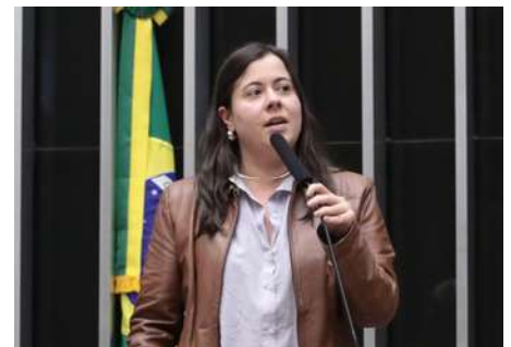
Dep. Sâmia Bomfim | PSOL-SP