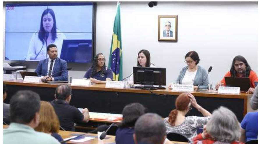
Dep. Erika Kokay | PT-DF