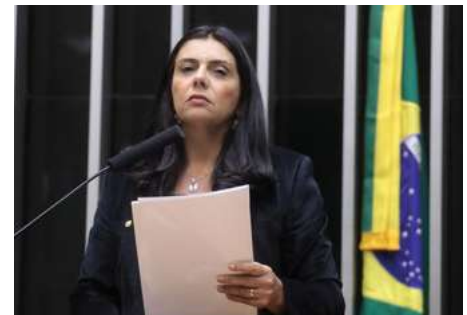
Dep. Delegada Ione | AVANTE-MG