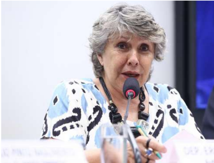
Dep. Erika Kokay | PT-DF