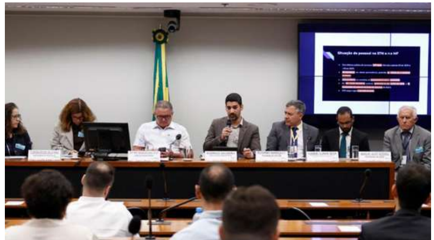
Dep. Erika Kokay | PT-DF