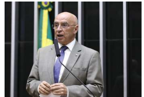
Dep. Mário Heringer | PDT-MG