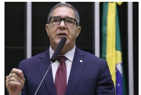
Dep. Luiz Gastão | PSD-CE