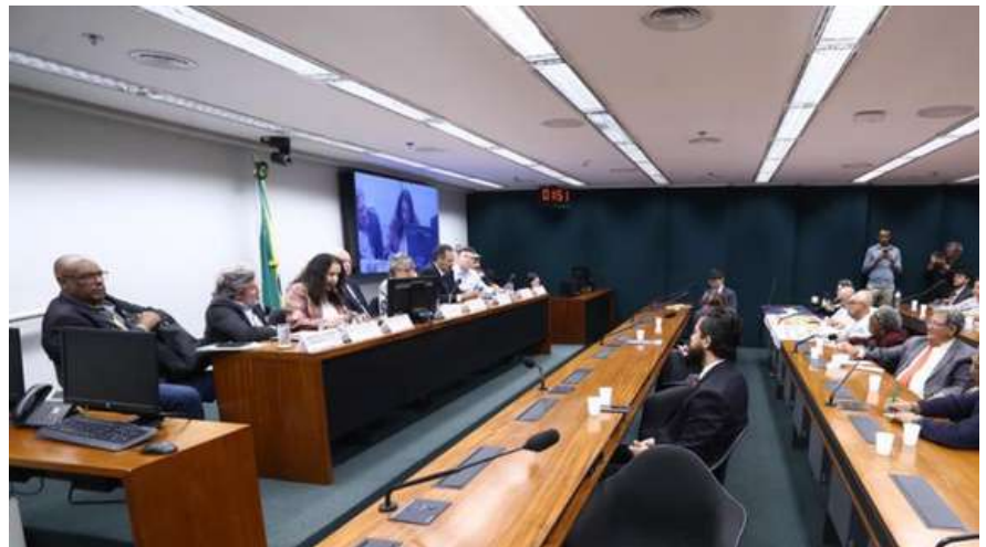
Dep. Erika Kokay | PT-DF