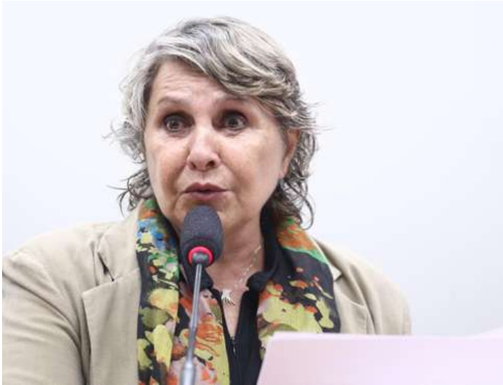
Dep. Erika Kokay | PT-DF