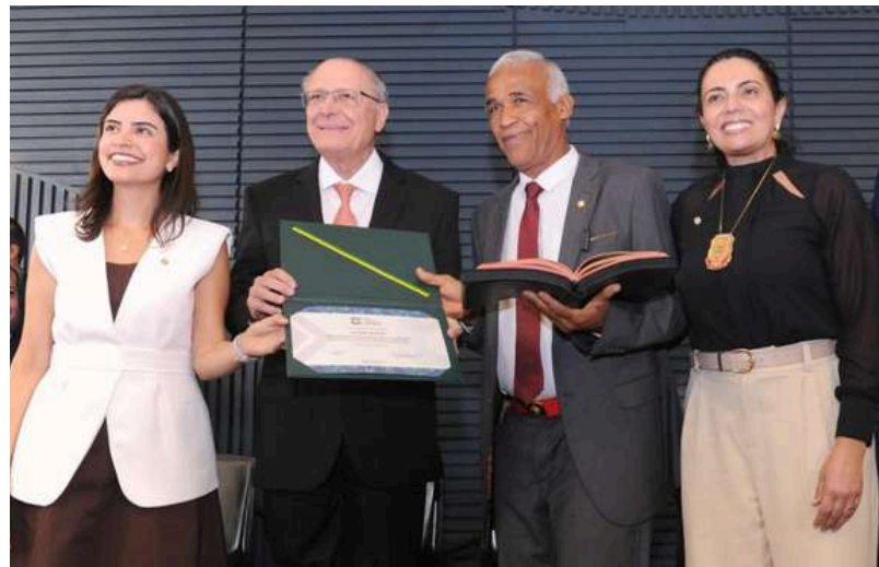
Renato Araújo / Câmara dos Deputados

Vice-presidente da República e ministro do MDIC. Conduziu resposta ágil e inovadora contra sobretaxas impostas pelos EUA, preservando empregos, cadeias produtivas e competitividade da indústria nacional. Liderou modelo de governança interministerial replicável para crises econômicas.