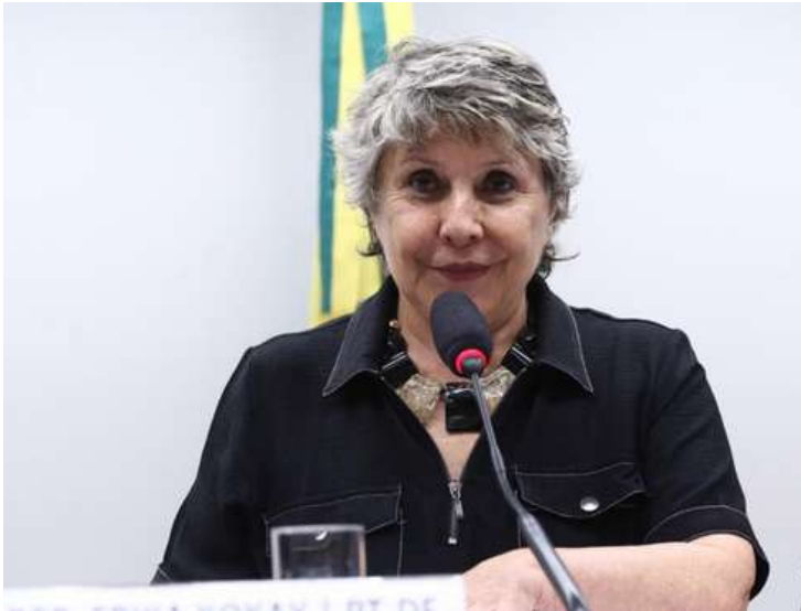
Dep. Erika Kokay | PT-DF