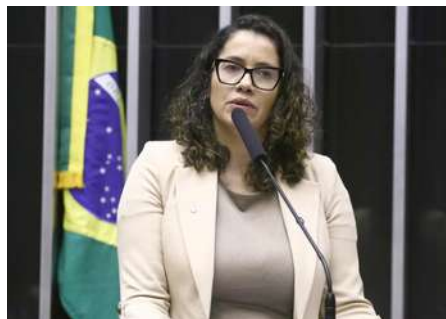
Dep. Denise Pessôa | PT-RS