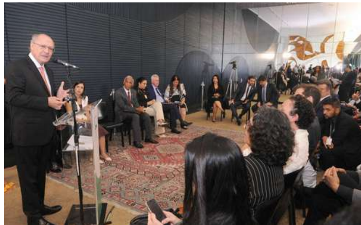
Renato Araújo / Câmara dos Deputados