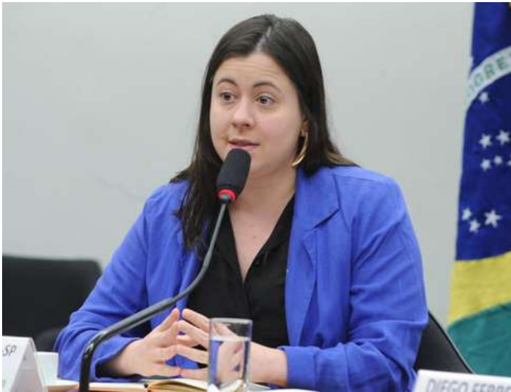
Dep. Sâmia Bomfim | PSOL-SP