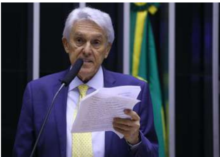
Dep. João Maia