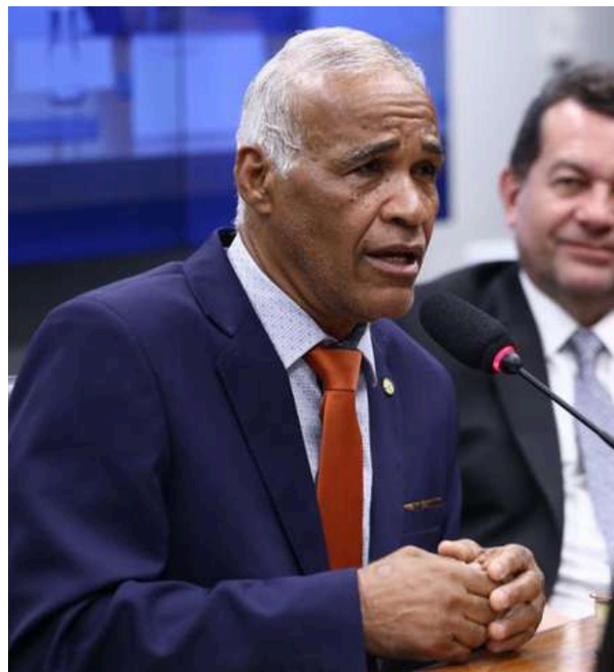
Dep. Pastor Sargento Isidório | AVANTE - BA

Também elogiou os membros e a equipe de assessoria da Comissão. Por fim, declarou oficialmente a eleição da chapa para a 1ª Vice-Presidência da Comissão e convidou a Deputada Delegada Ione a compor a Mesa, destacando que a presença das mulheres nas posições de poder é legítima e que elas estão ocupando seus espaços, não tomando os dos homens.