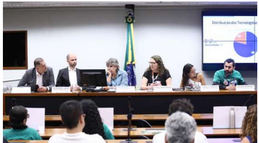
Dep. Erika Kokay | PT-DF