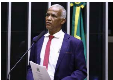
Dep. Pastor Sargento Isidório | AVANTE-BA