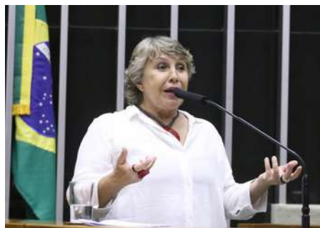
Dep. Erika Kokay | PT-DF