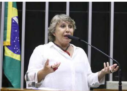
Dep. Erika Kokay | PT-DF