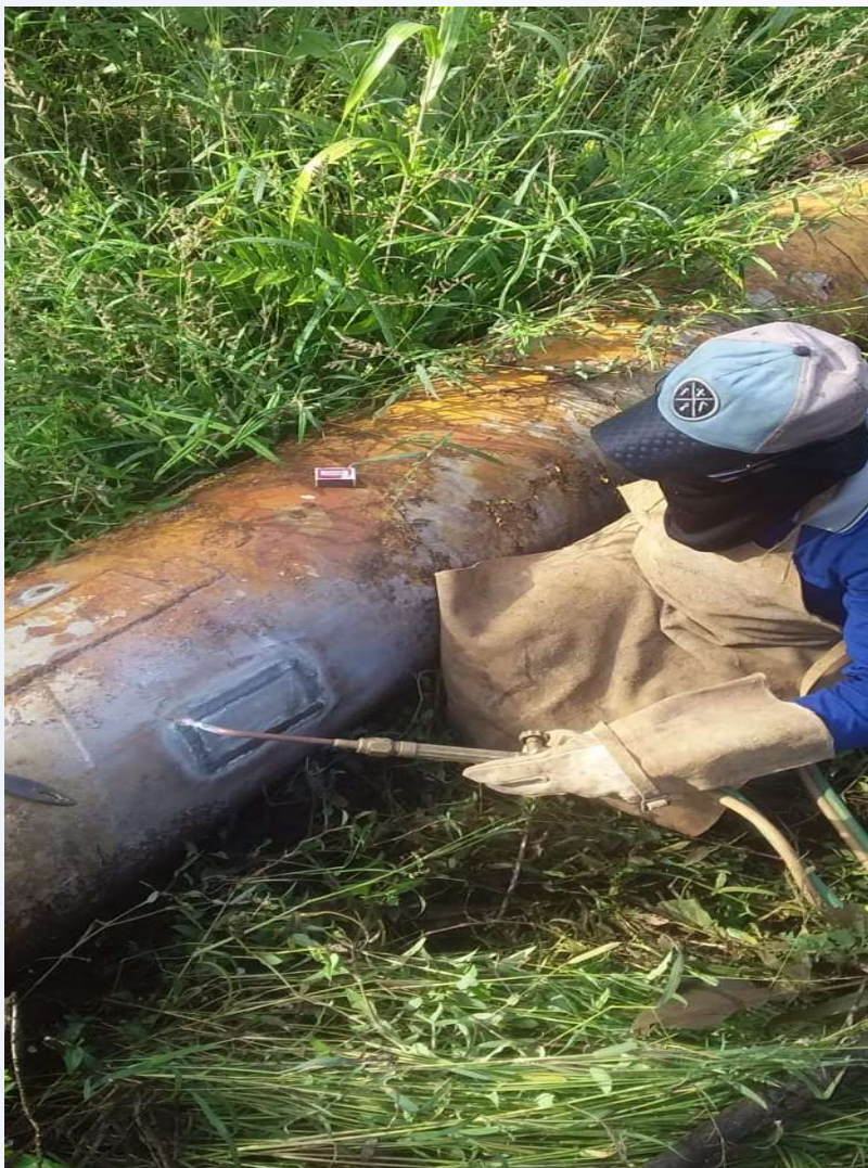
Tubulação com vazamento