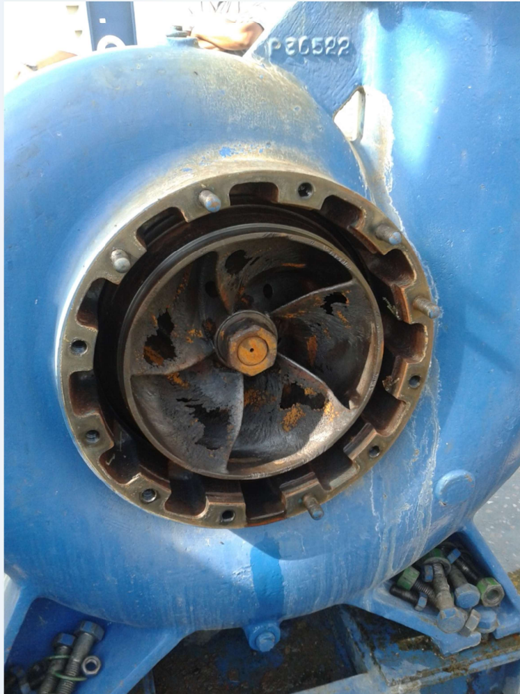
Projeto Icó-Mandantes - PE: Bomba com rotor danificado