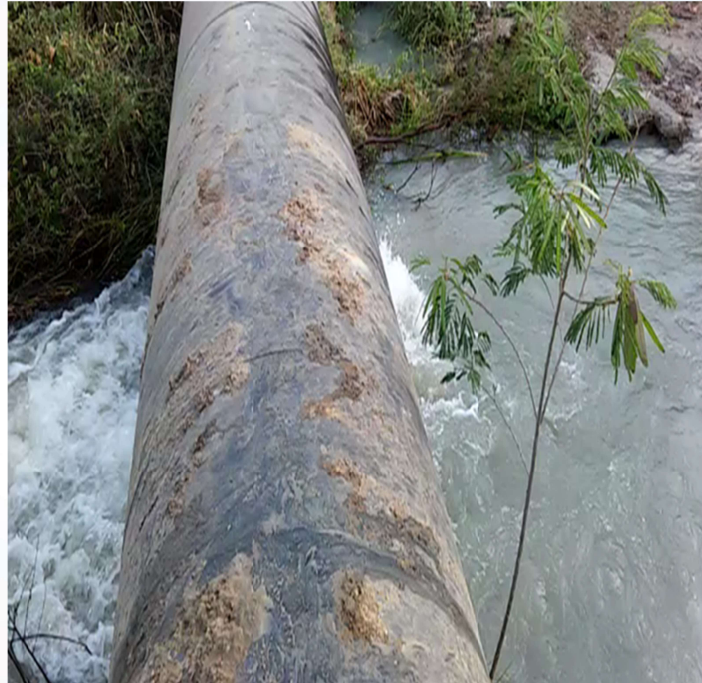
Projeto Rodelas - BA: Canal avariado