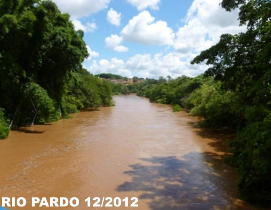
RIO PARDO 12/2012