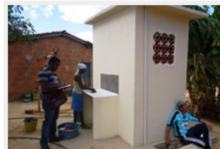
Moradora do Assentamento Califórnia aproveita melhorias com instalação de MSD

MSD são intervenções promovidas, prioritariamente, nos domicílios e eventualmente intervenções coletivas de pequeno porte, e, inclui a construção de módulos sanitários, banheiro, tanque séptico, sumidouro (poço absorvente), instalações de reservatório domiciliar de água, tanque de lavar roupa, lavatório, pia de cozinha, ligação à rede pública de água, ligação à rede pública de esgoto, dentre outras.