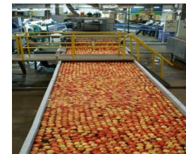
Evolução das exportações, importações e do saldo comercial brasileiro de maçã

Conforme ilustra o gráfico abaixo, desde 2010, a balança comercial brasileira de maçã vem apresentando recorrente déficits (...).