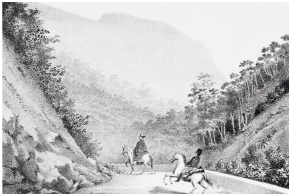
TAQUARIL. LITOGRAFIA DO LIVRO “DOZE HORAS EM DILIGÊNCIA”