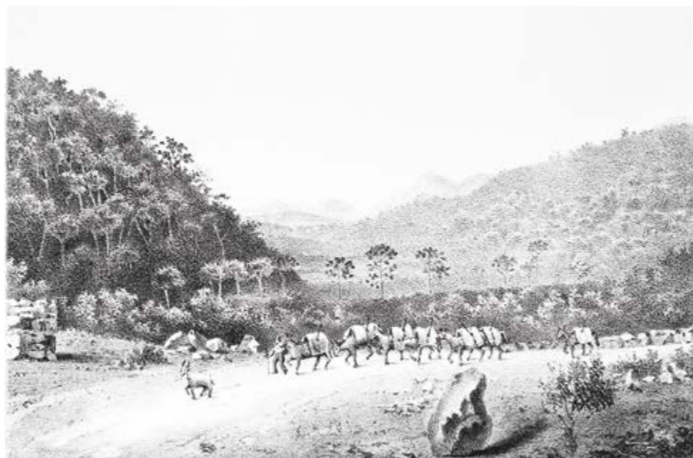
TROPA EM MARCHA. LITOGRAFIA DO LIVRO “DOZE HORAS EM DILIGÊNCIA”:

Antes do surgimento da Companhia União e Indústria e da construção da estrada de rodagem macadamizada de mesmo nome, que possibilitou o tráfego de grandes e resistentes carroções, todo o transporte de mercadorias entre as províncias de Minas Gerais e do Rio de Janeiro era feito em lombo de burro.