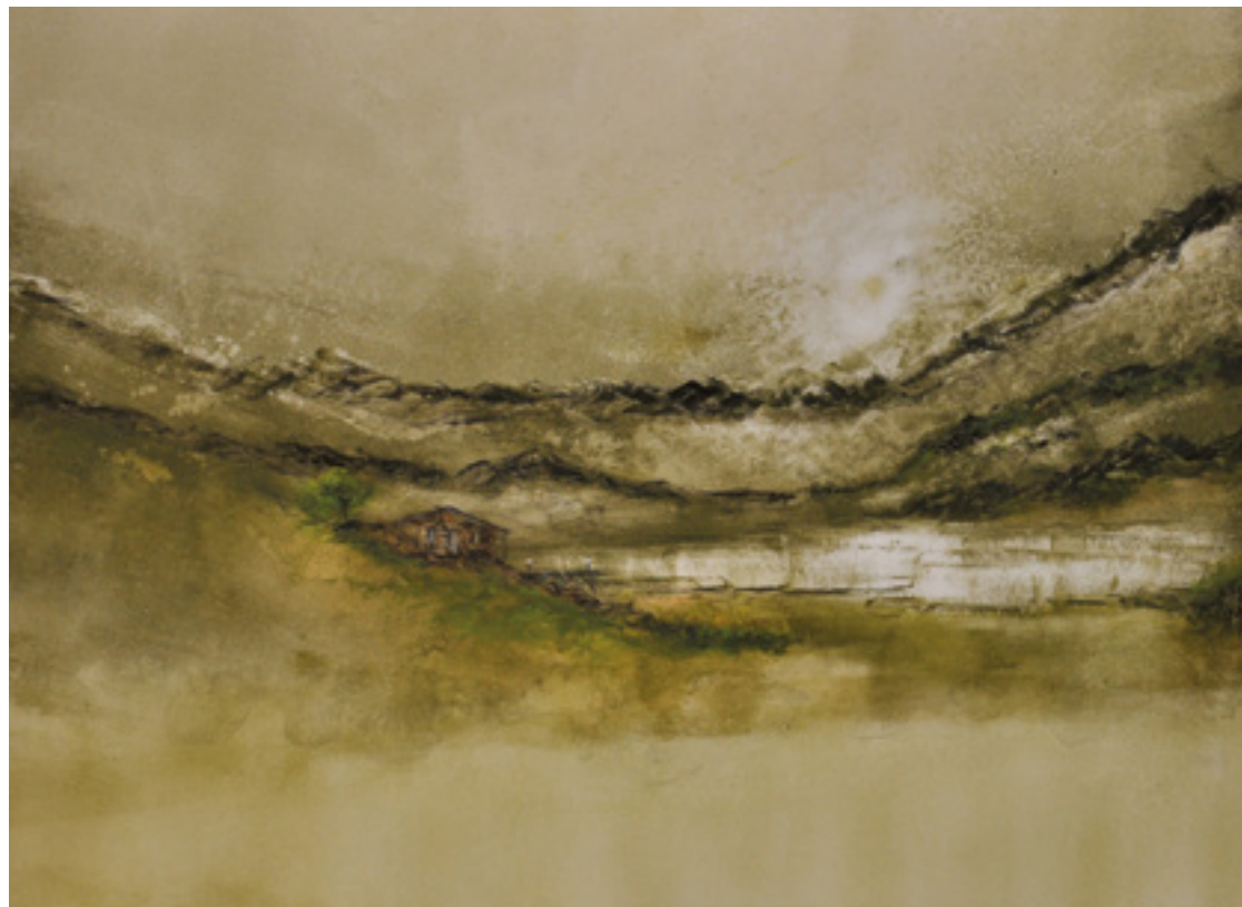
O QUE É SÓ SEU ACRÍLICA SOBRE CARTÃO 48 X 66 CM 2014