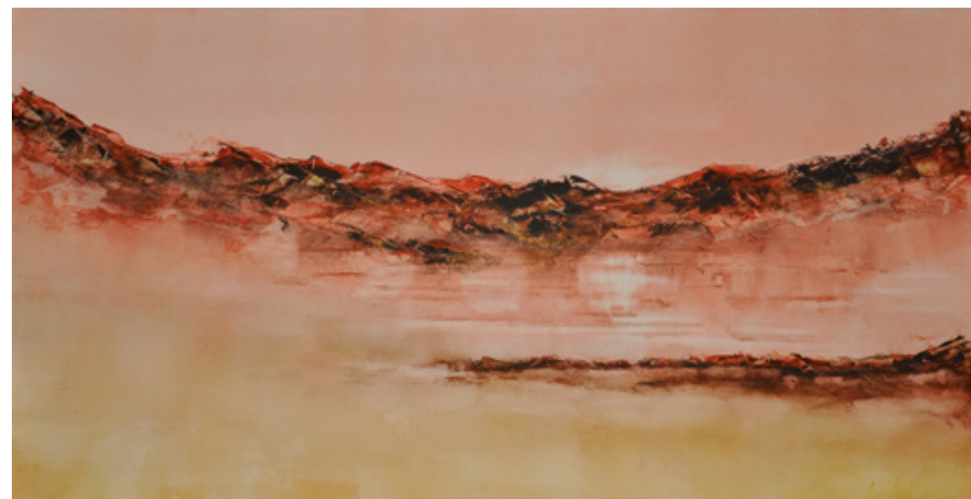
LAGOS E MONTANHAS II ACRÍLICA SOBRE CARTÃO 50 X 96 CM 2014