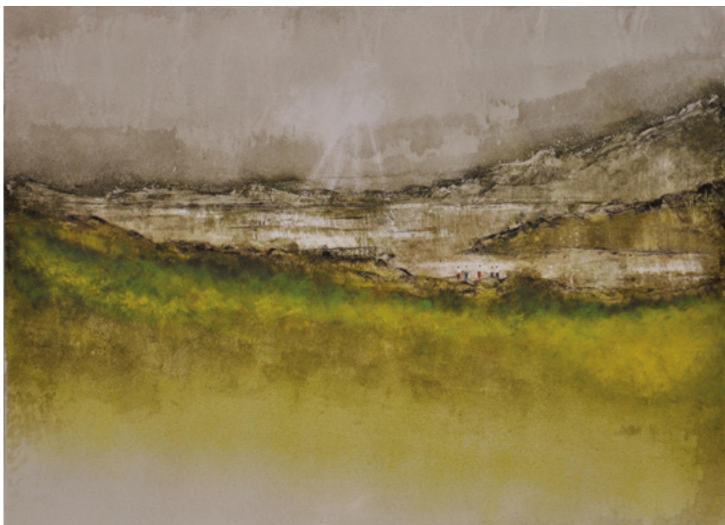
FOI ASSIM! ACRÍLICA SOBRE CARTÃO 48 X 66 CM 2014