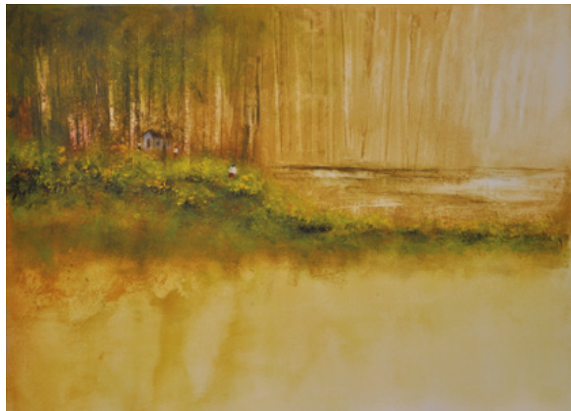
NA DIREÇÃO DO DIA ACRÍLICA SOBRE CARTÃO 48 X 66 CM 2014