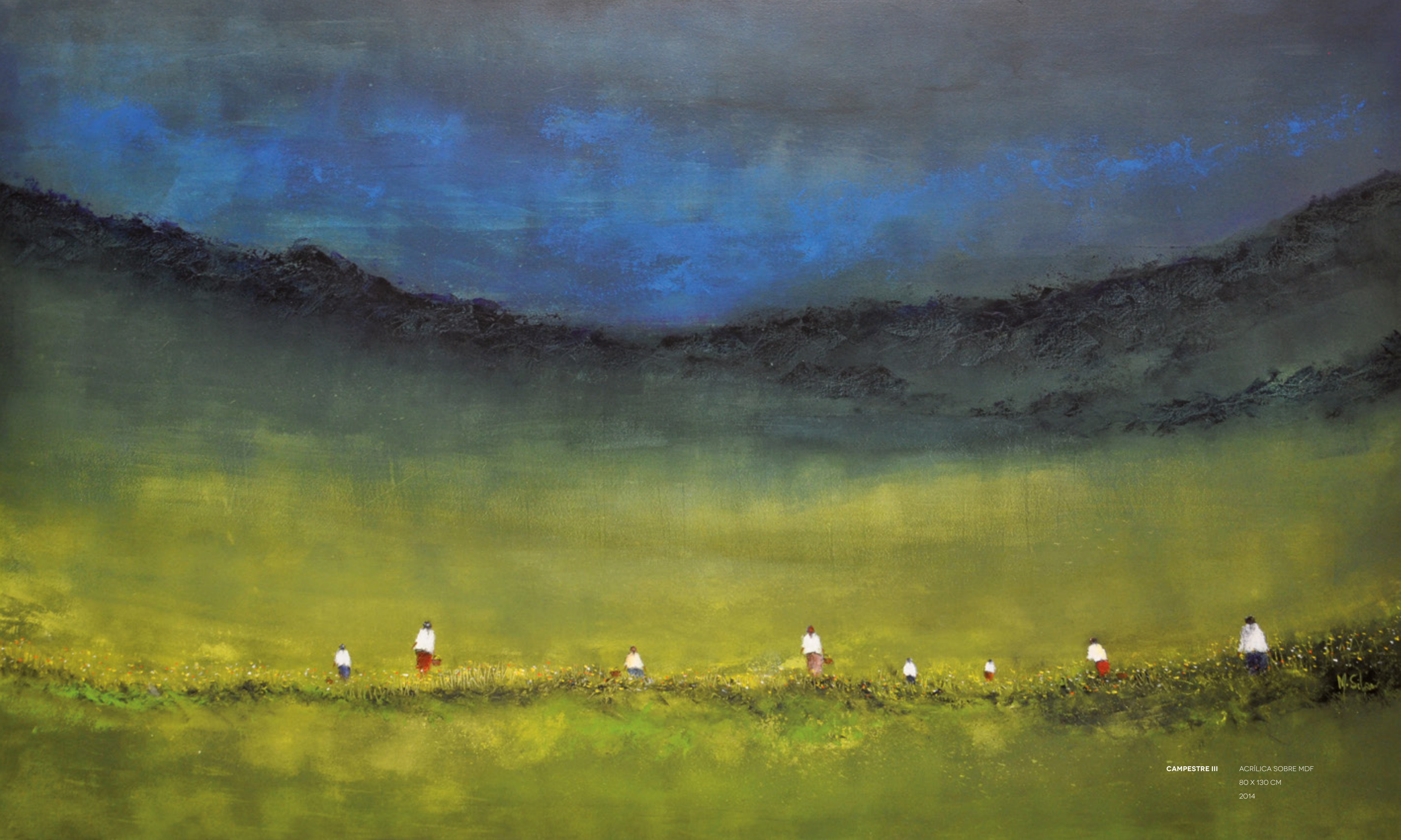
CAMPESTRE III ACRÍLICA SOBRE MDF 80 X 130 CM 2014