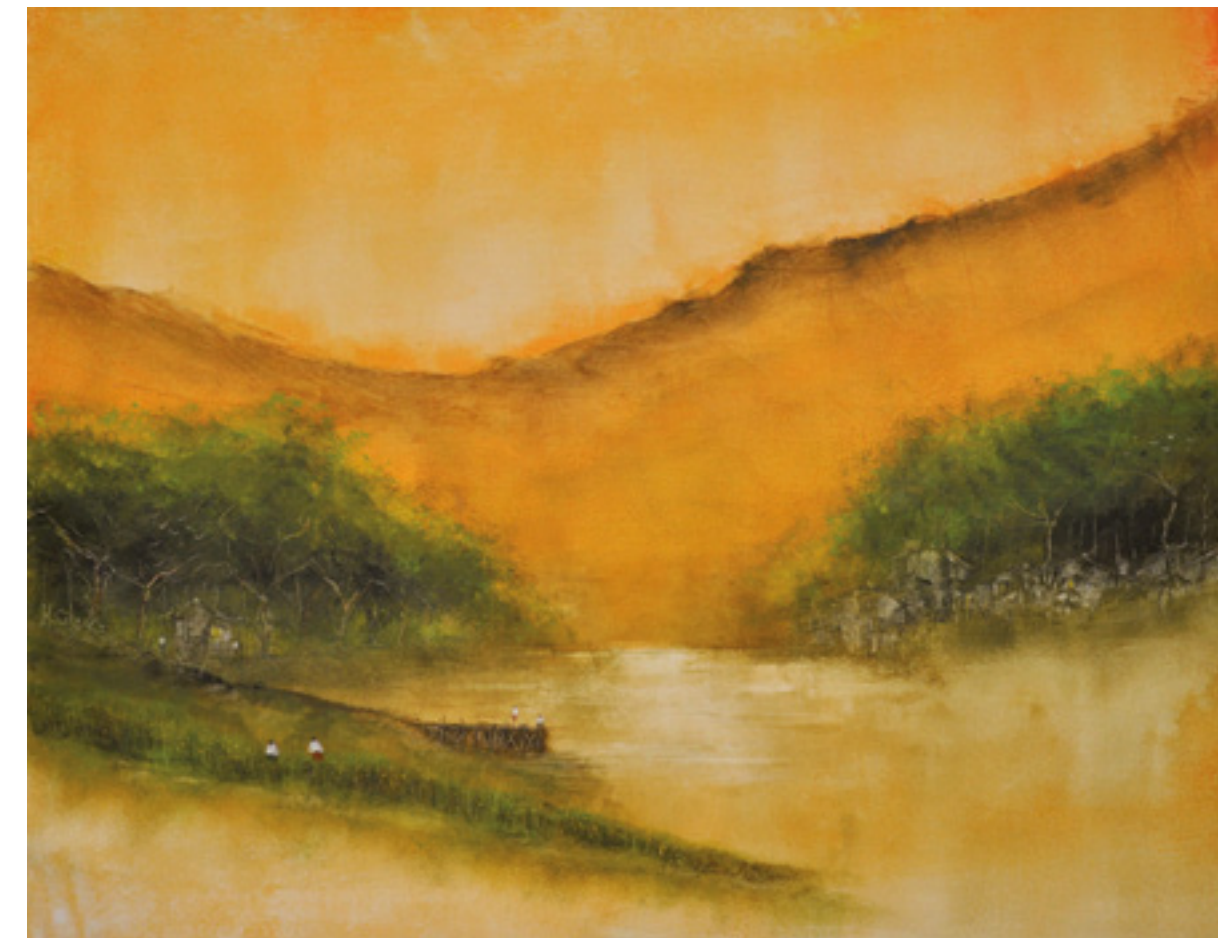
BETTER DAYS ACRÍLICA SOBRE TELA 63 X 82 CM 2014