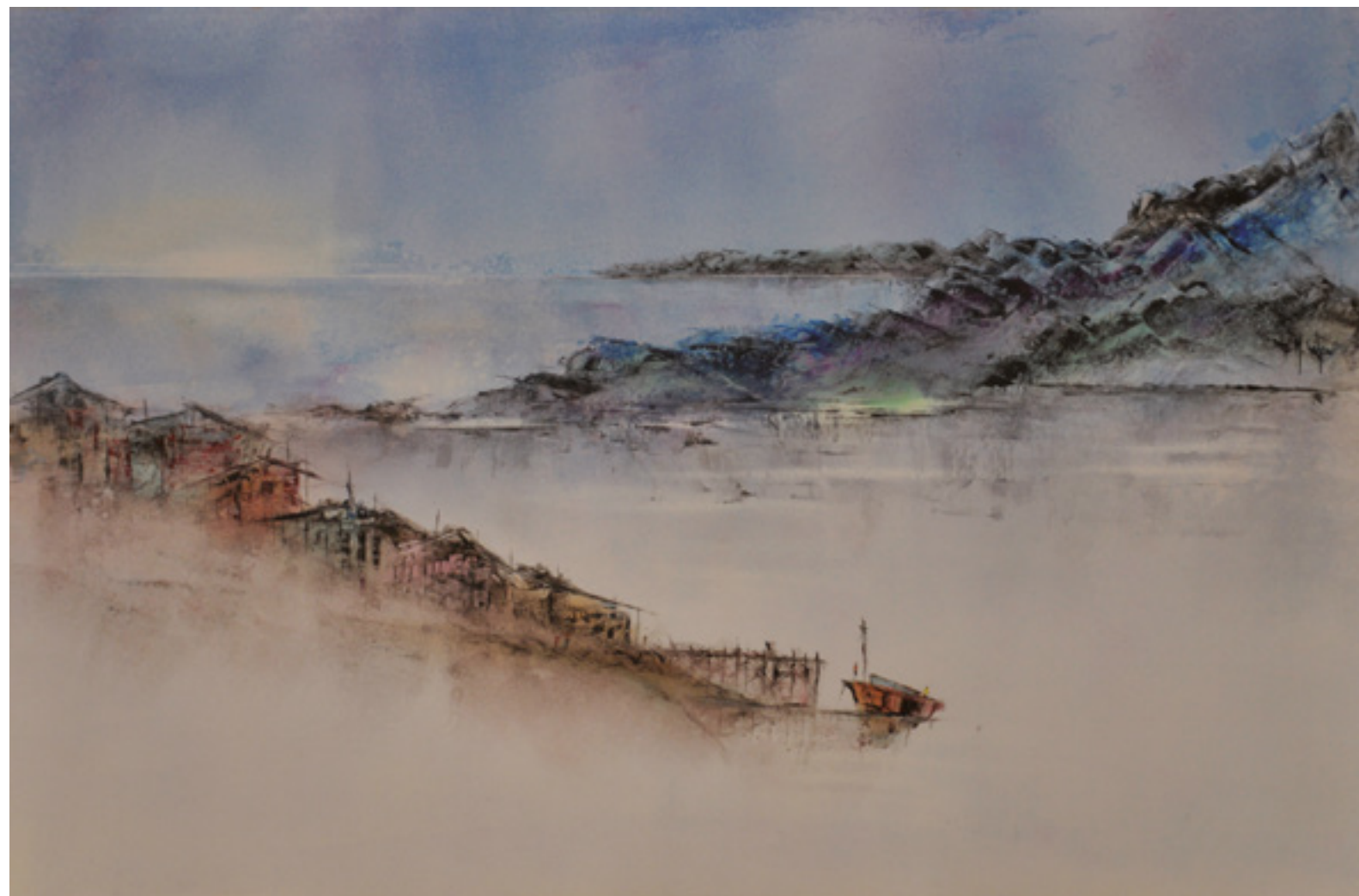
MARÍTIMO II ACRÍLICA SOBRE CARTÃO 37 X 56 CM 2014