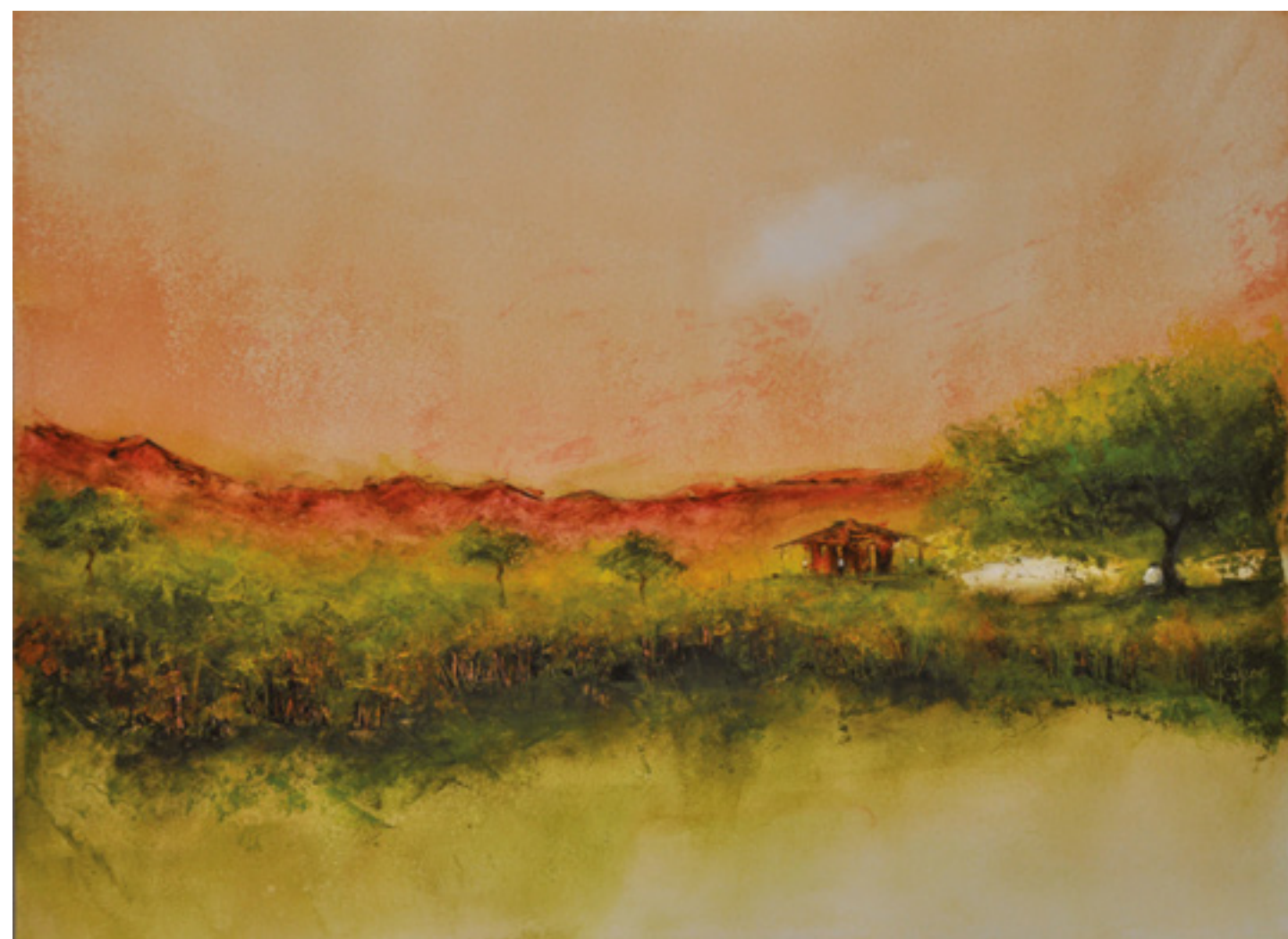
POR TUDO QUE SE SABE ACRÍLICA SOBRE CARTÃO 48 X 66 CM 2014