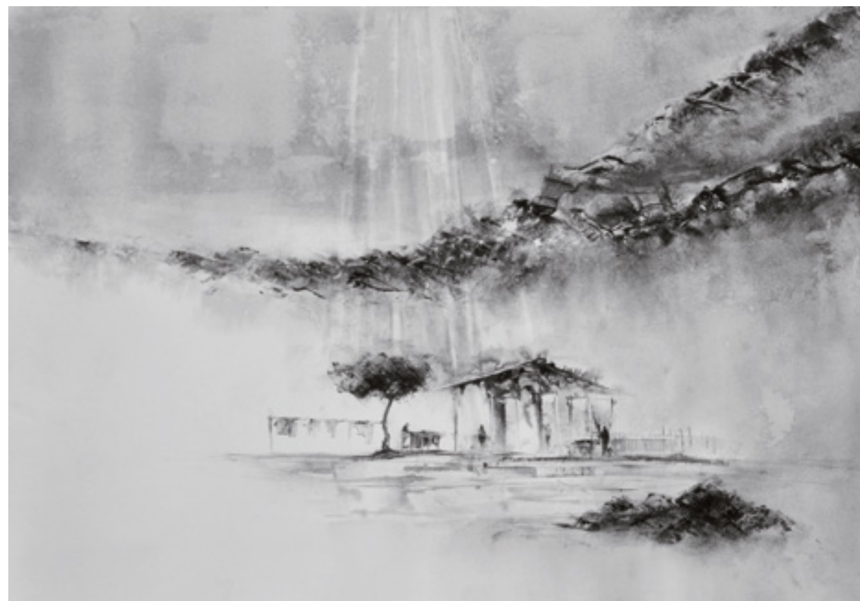
NOIR ACRÍLICA SOBRE CARTÃO 46 X 66 CM 2014