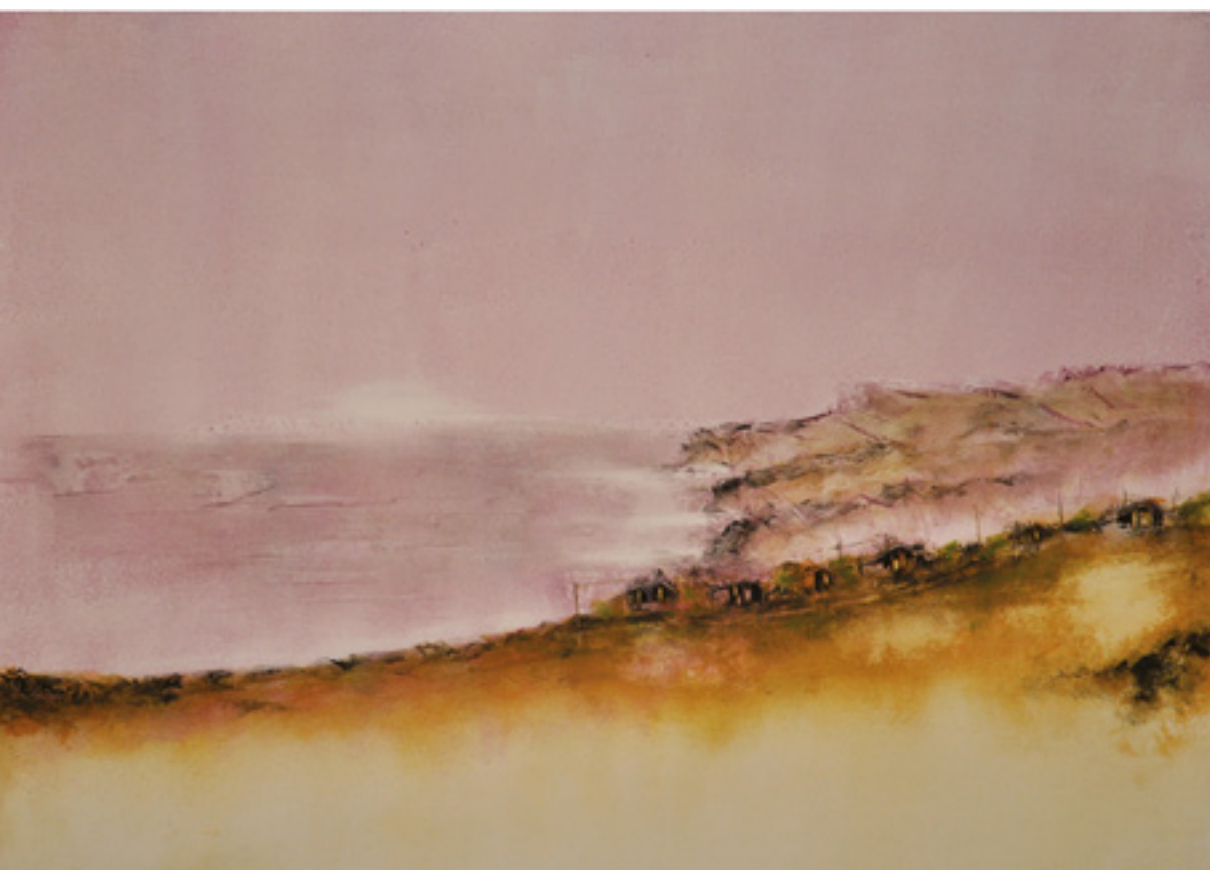
PARAÍSO AGORA ACRÍLICA SOBRE CARTÃO 46 X 66 CM 2014