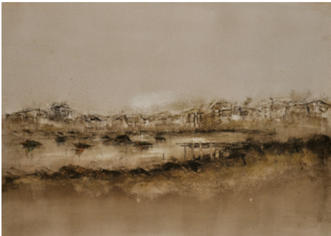
MARÍTIMO ACRÍLICA SOBRE CARTÃO 48 X 66 CM 2014