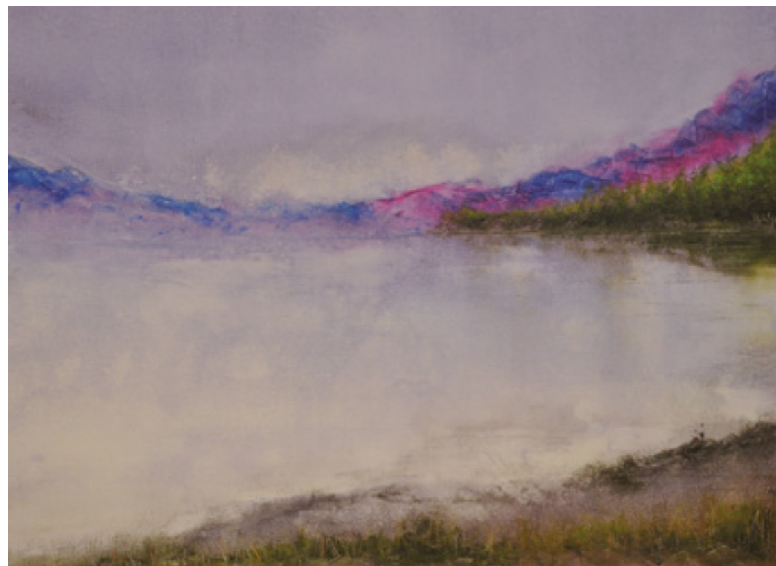
LOUVAÇÃO ACRÍLICA SOBRE TELA 48 X 66 CM 2014