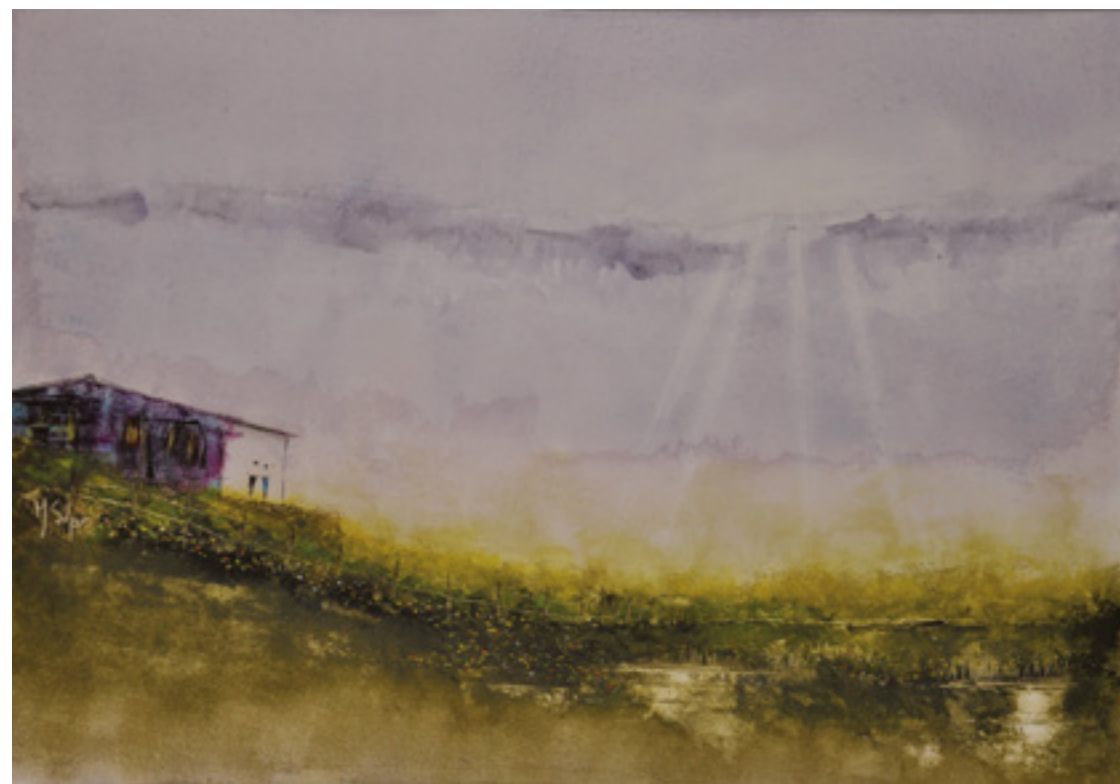
CAMPESTRE ACRÍLICA SOBRE CARTÃO 46 X 66 CM 2014