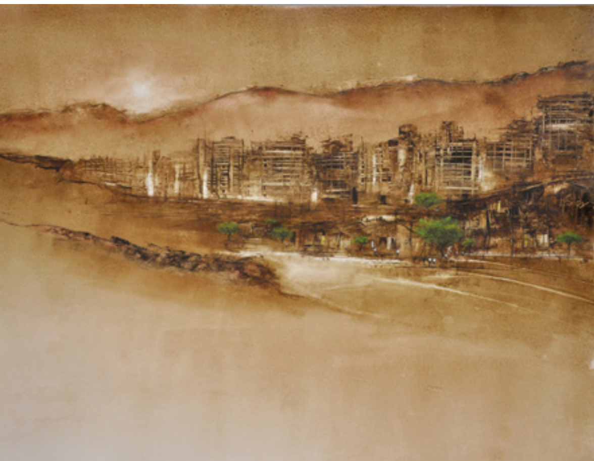
NESTE MESMO LUGAR ACRÍLICA SOBRE CARTÃO 63 X 82 CM 2014