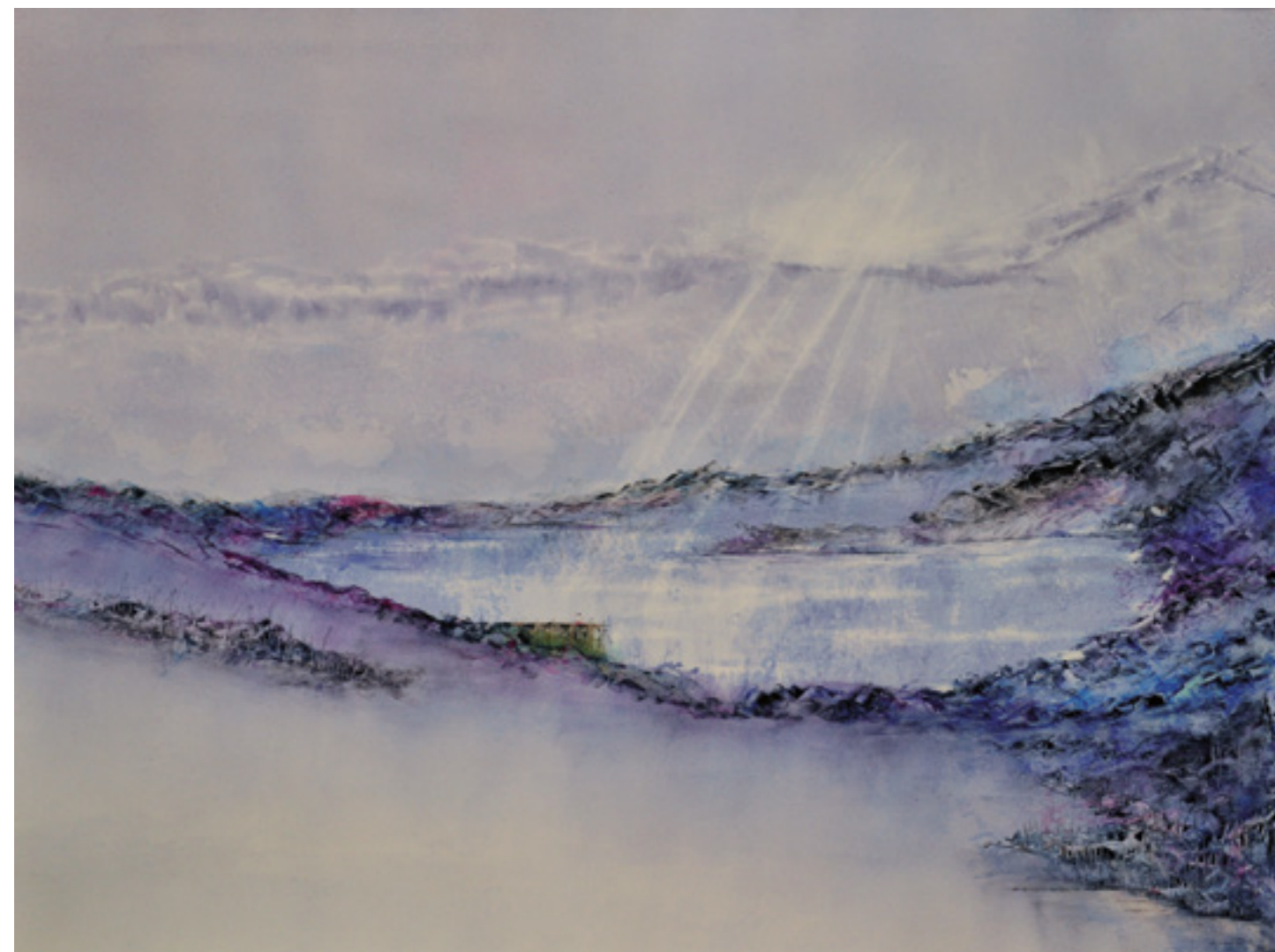
A VIOLINISTA ACRÍLICA SOBRE CARTÃO 63 X 82 CM 2014