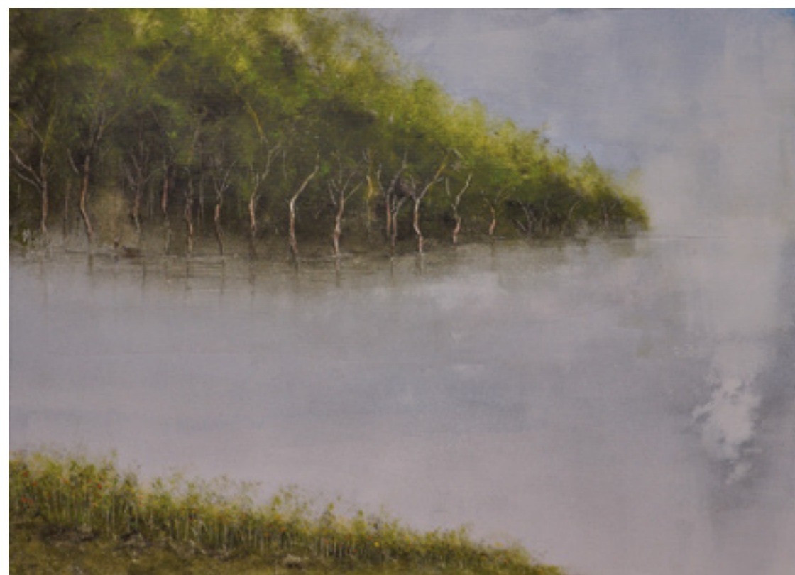
BEIRA D'ÁGUA ACRÍLICA SOBRE TELA 48 X 66 CM 2014