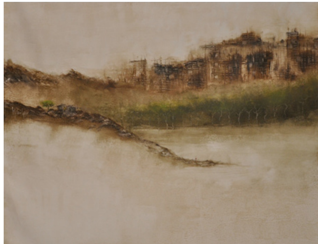
QUIÉTUDE IN SÉPIA ACRÍLICA SOBRE TELA 63 X 82 CM 2014