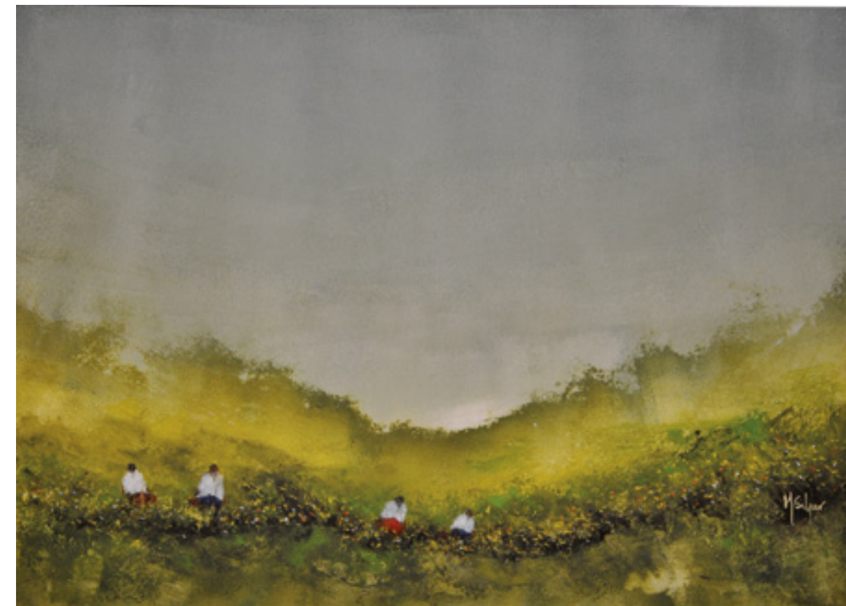
CAMPESTRE II ACRÍLICA SOBRE CARTÃO 46 X 66 CM 2014