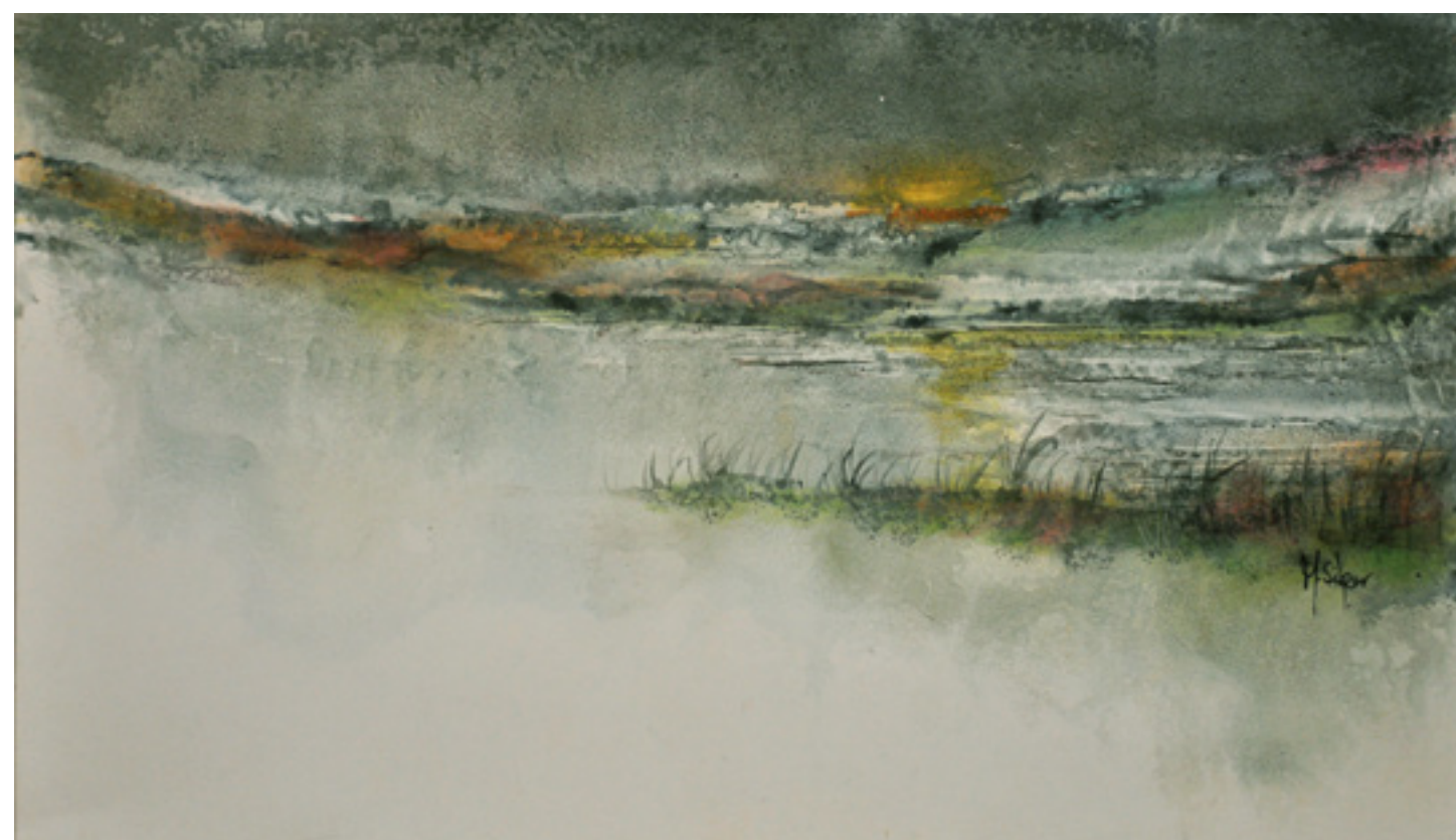
LAGOS E MONTANHAS ACRÍLICA SOBRE CARTÃO 29 X 28 CM 2012