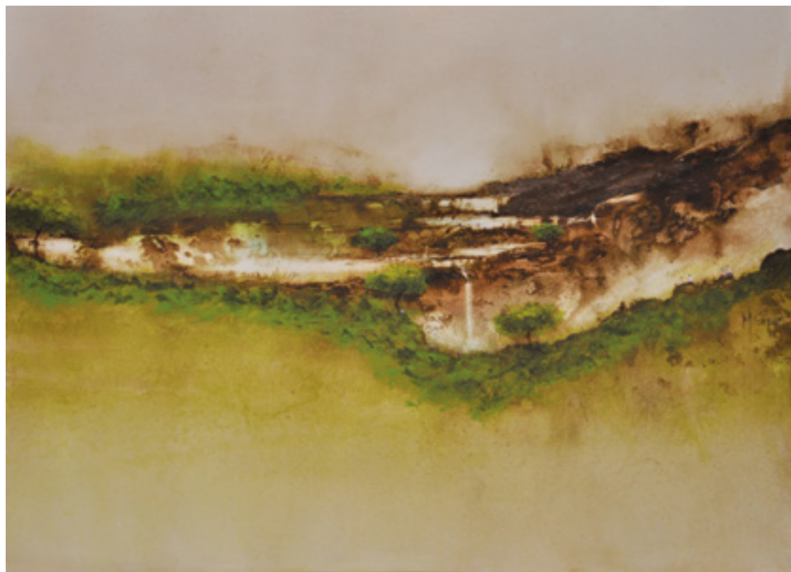
MAIS QUE NUNCA ACRÍLICA SOBRE CARTÃO 48 X 66 CM 2014