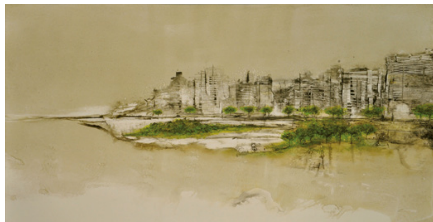
OLHAR URBANO ACRÍLICA SOBRE CARTÃO 50 X 96 CM 2014