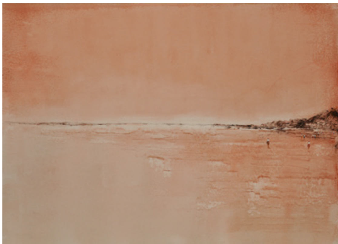
DEPOIS DA CHUVA ACRÍLICA SOBRE CARTÃO 46 X 66 CM 2014