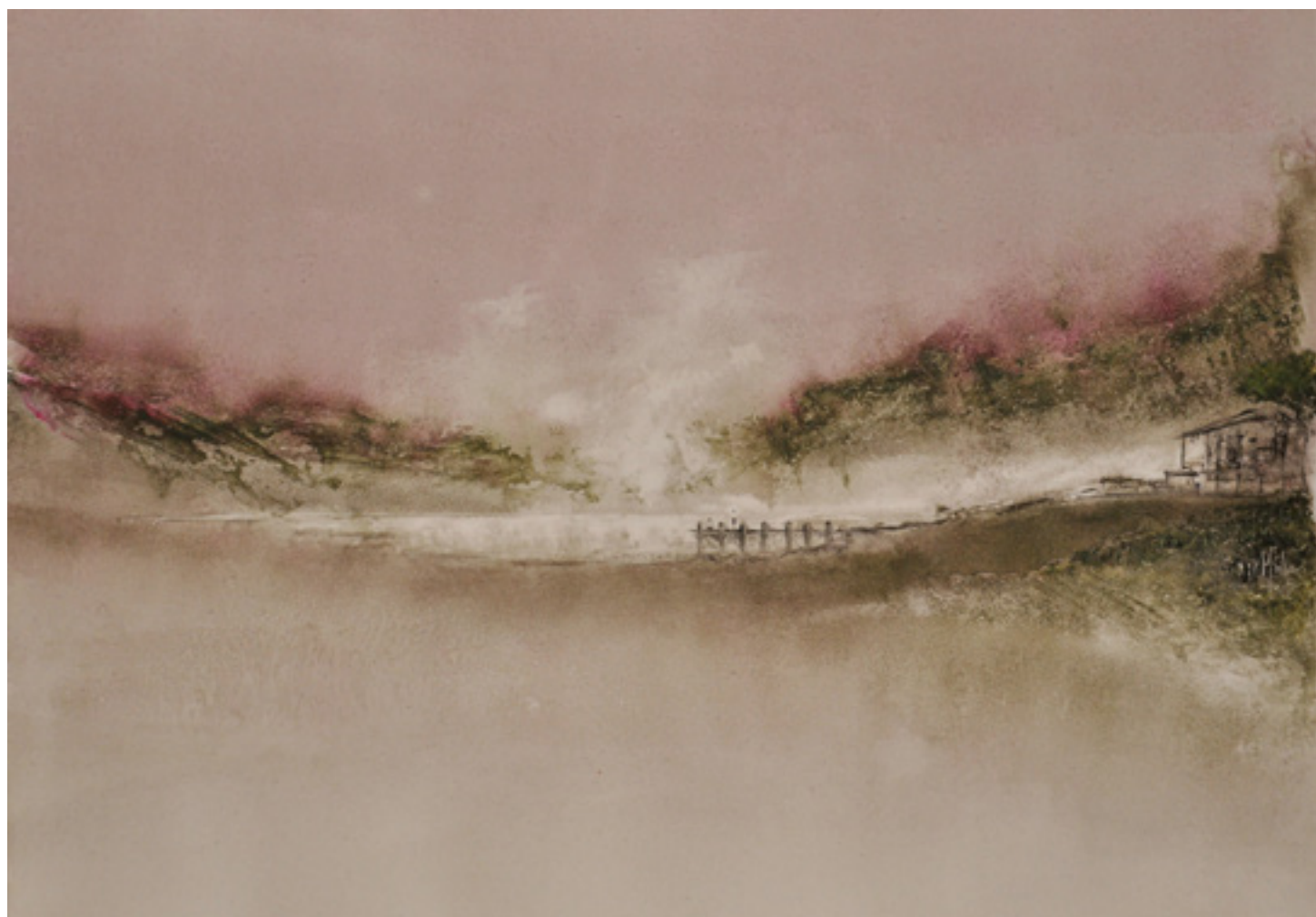
A VIDA QUE DIZ ACRÍLICA SOBRE CARTÃO 46 X 66 CM 2014