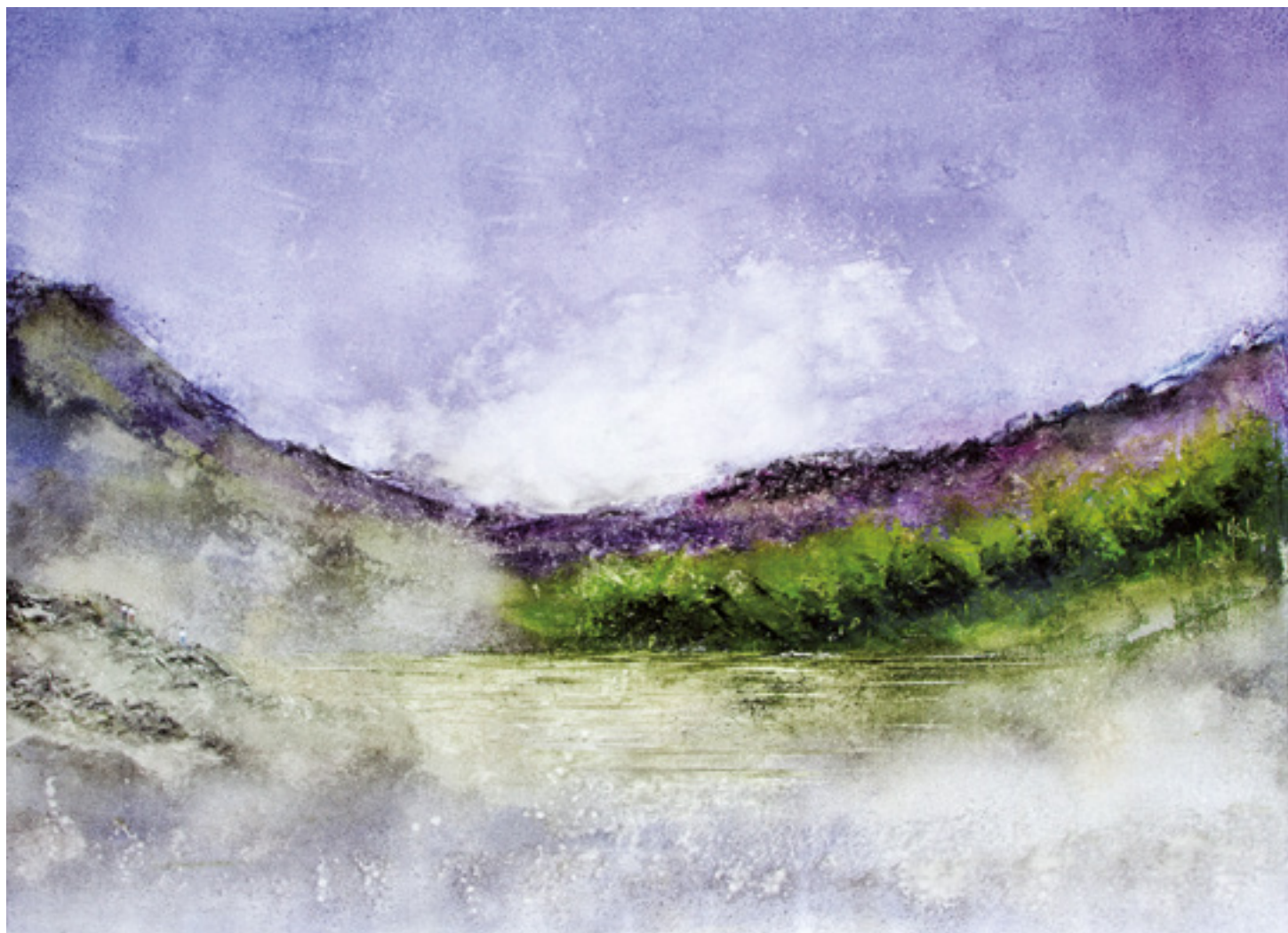
AVEC CLAUDE ACRÍLICA SOBRE TELA 48 X 66 CM 2015