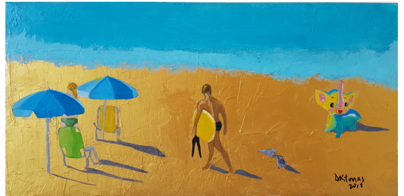
Elefante Acrílico e óleo sobre tela 20 x 40 cm 2018