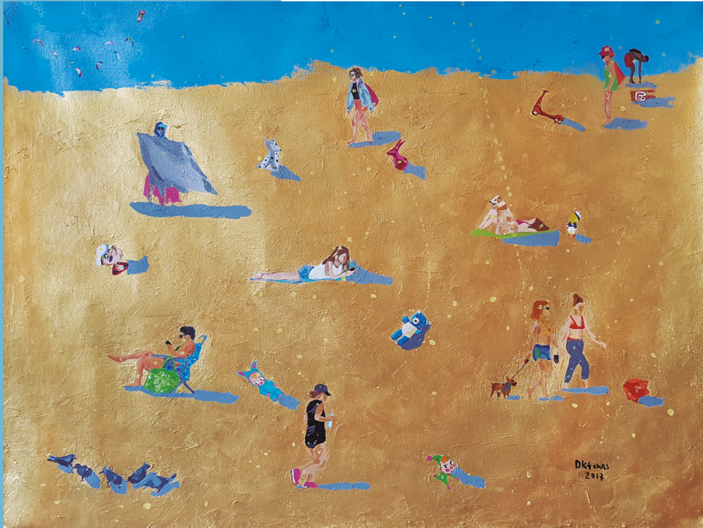
Sábado Acrílica sobre tela 60 x 88 cm 2017