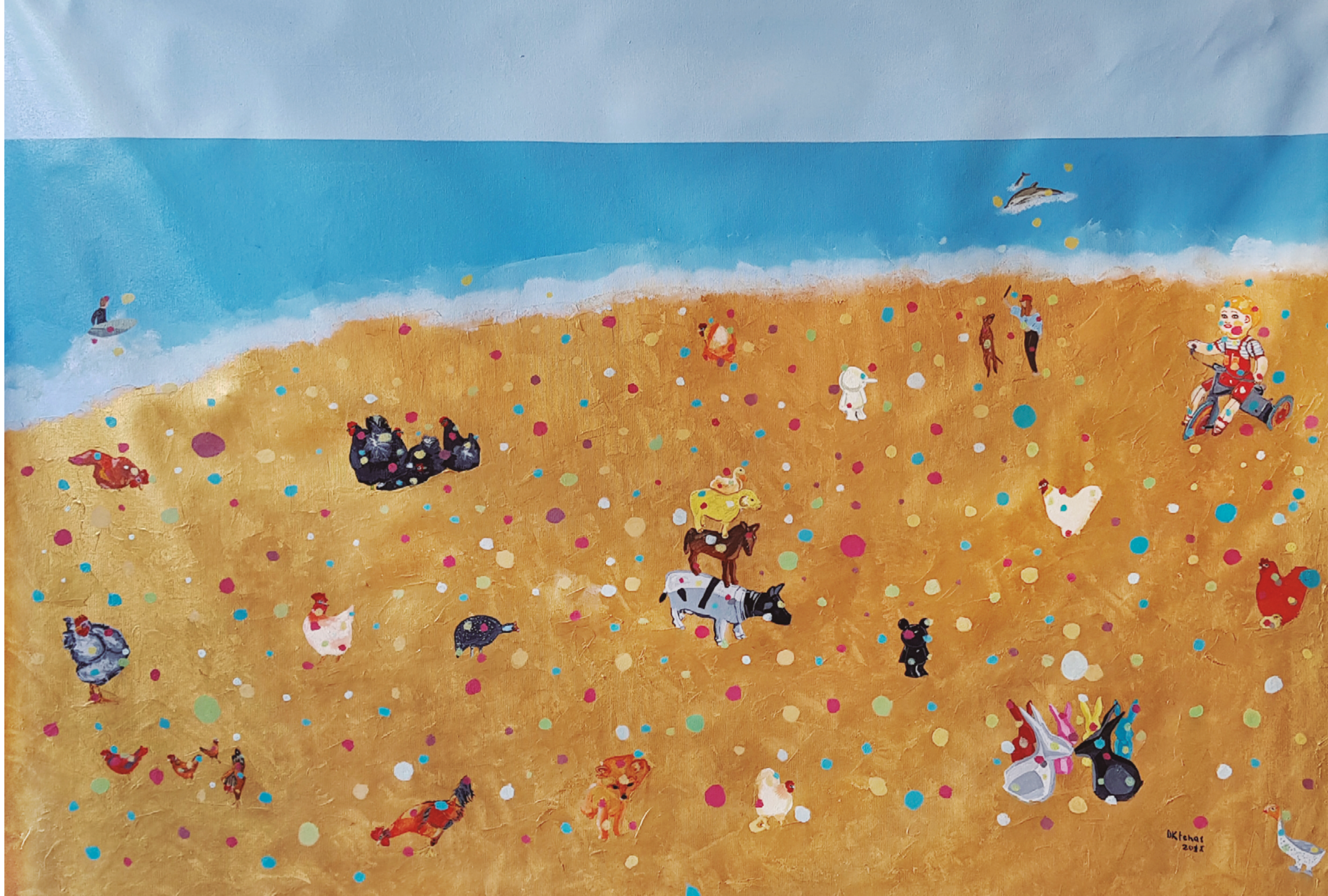
É feriado Acrílica sobre tela 80 x 105 cm 2018