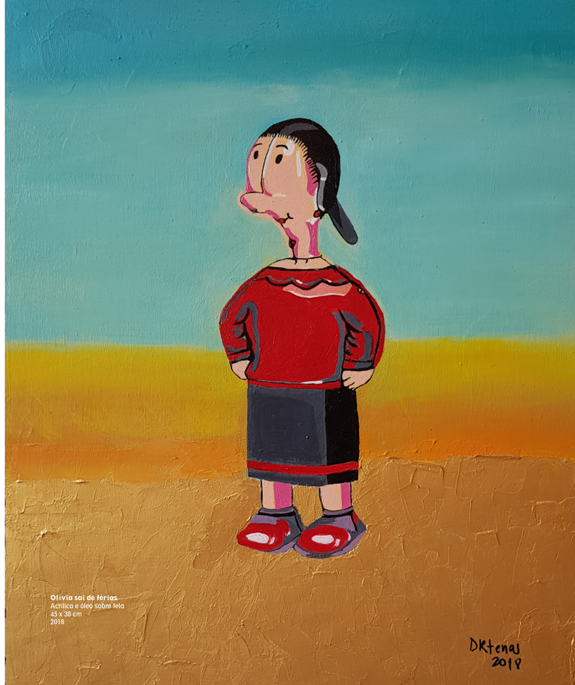
Olivia sai de férias Acrílica e óleo sobre tela 45 x 38 cm 2018