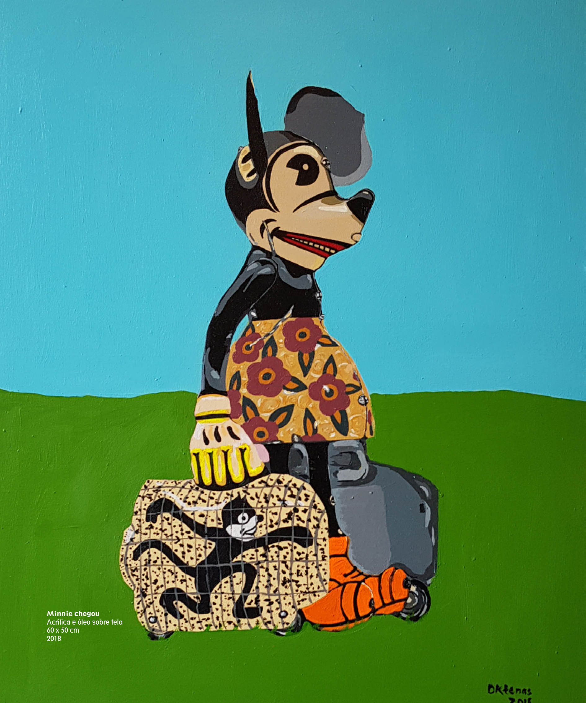
Minnie chegou Acrílico e óleo sobre tela 60 x 50 cm 2018