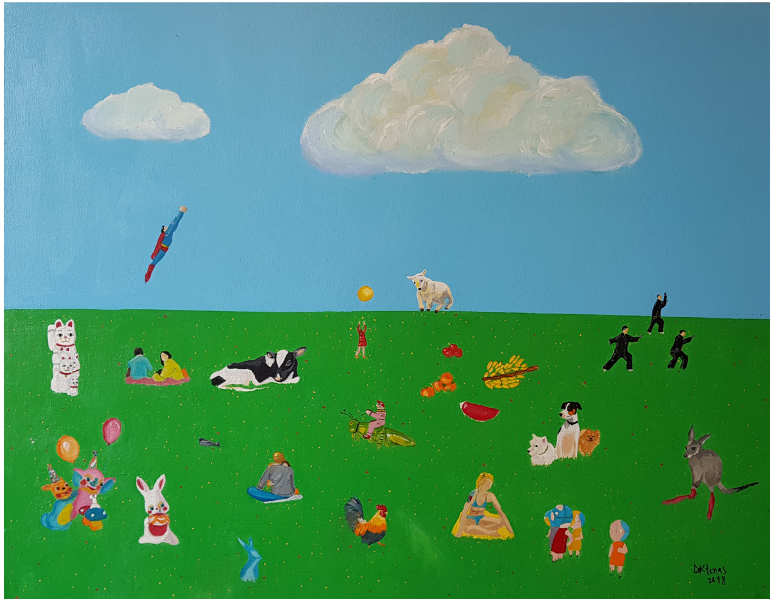
Aniversário no parque Acrílica e óleo sobre tela 70 x 90 cm 2018