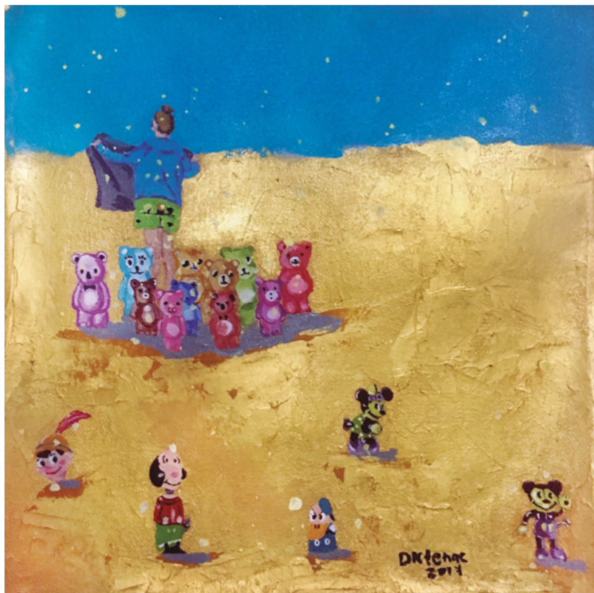
Ursinhos Acrílica sobre tela 30 x 30 cm 2017