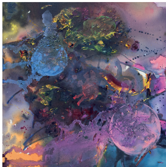
Deformados pelo Sol Acrílica sobre tela 2016