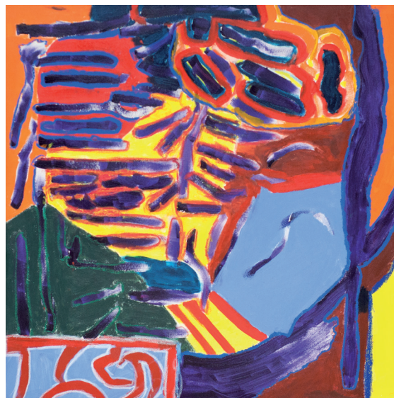
Sem título Acrílica sobre tela 2014