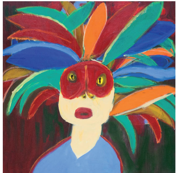
Sem título Acrílica sobre tela 2014