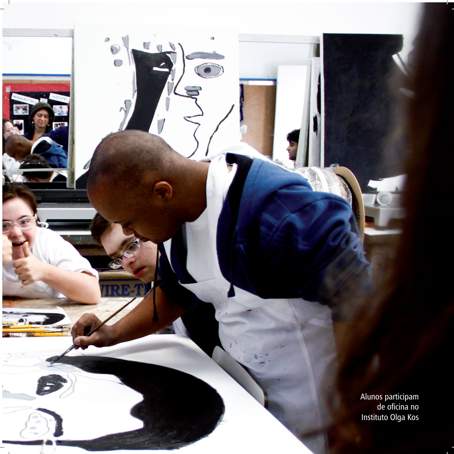
Alunos participam de oficina no Instituto Olga Kos