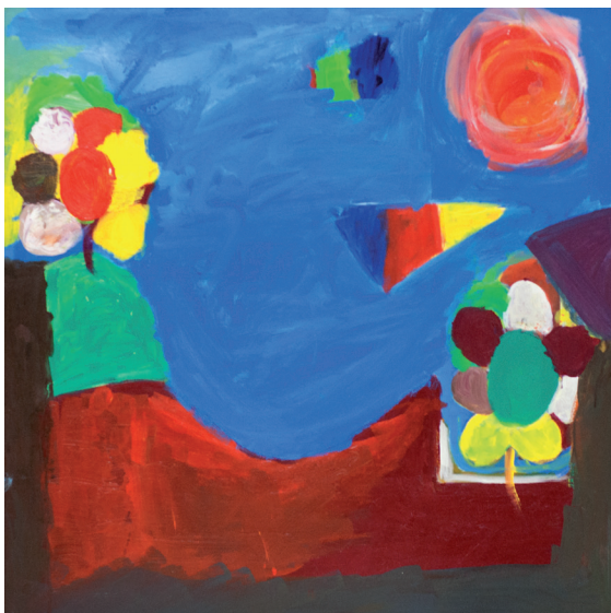
Sem título Acrílica sobre tela 2015