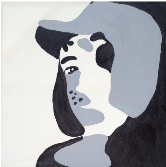
Chaves Acrílica sobre tela 2013