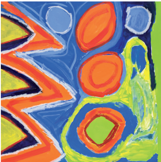
Sem título Acrílica sobre tela 2014