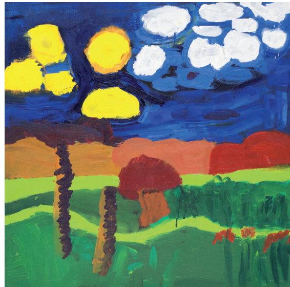
Sem título Acrílica sobre tela 2015