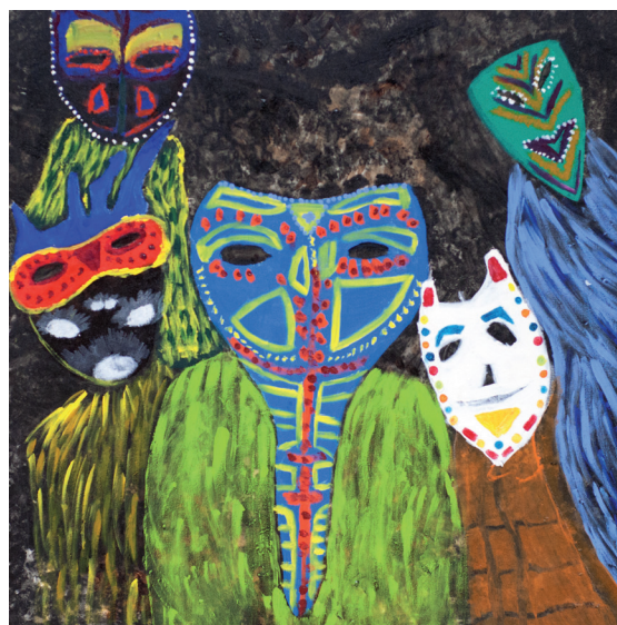
Inimigos dos Fantasmas Acrílica sobre tela 2014