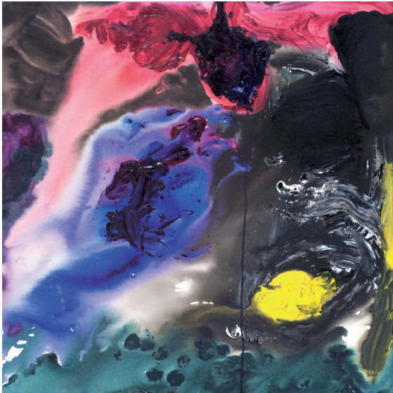
Universo Surreal Acrílica sobre tela 2016