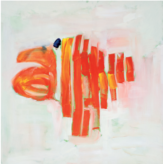
Sem título Acrílica sobre tela 2009