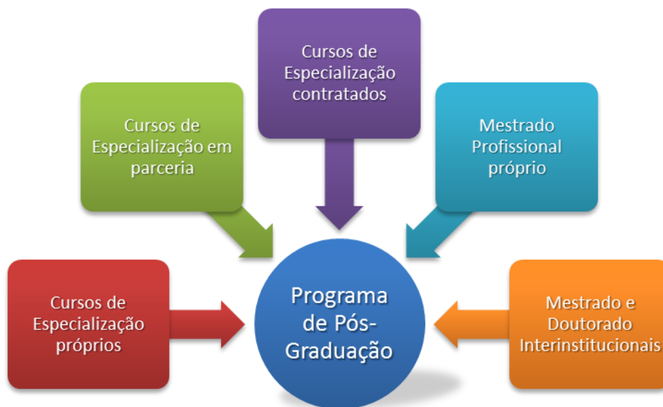
Figura 1: Oferta de Cursos do Programa

Até o final de 2021, o Programa realizou 42 cursos/turmas (considerando novos cursos, edições de cursos já ofertados ou turmas de cursos regulares, como o Mestrado), com entrada de 1.012 alunos regulares. Concluíram seus cursos com aprovação 880 alunos regulares, incluindo 114 mestres formados no Mestrado Profissional em Poder Legislativo. Além desses, houve a entrada de 1.583 alunos especiais, sendo quase a totalidade (99%) no Mestrado.