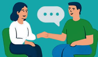
Atendimento presencial (Requer ambiente de acolhimento)