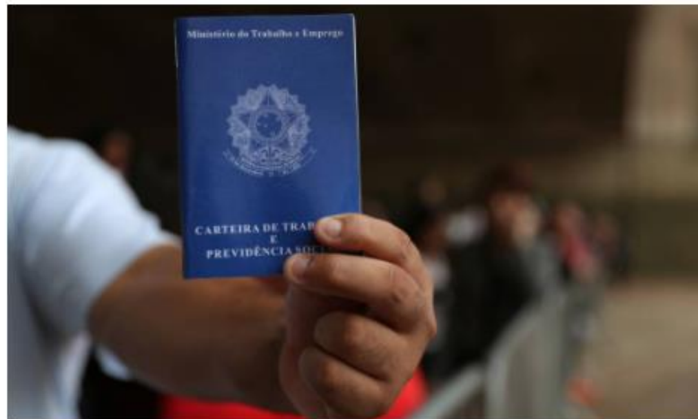
Trabalhador segura carteira de trabalho

https://oglobo.globo.com/economia/dados-contrariam-ministro-da-educacao-emprego-com-diploma-o-unico-que-cresce-no-brasil-1-25168846?fbclid=IwAR3L3QMwC5Mmym0VE1YAlqkaFBivFfeTgPtVSvEnOOBq26H2VwOg8LpSew