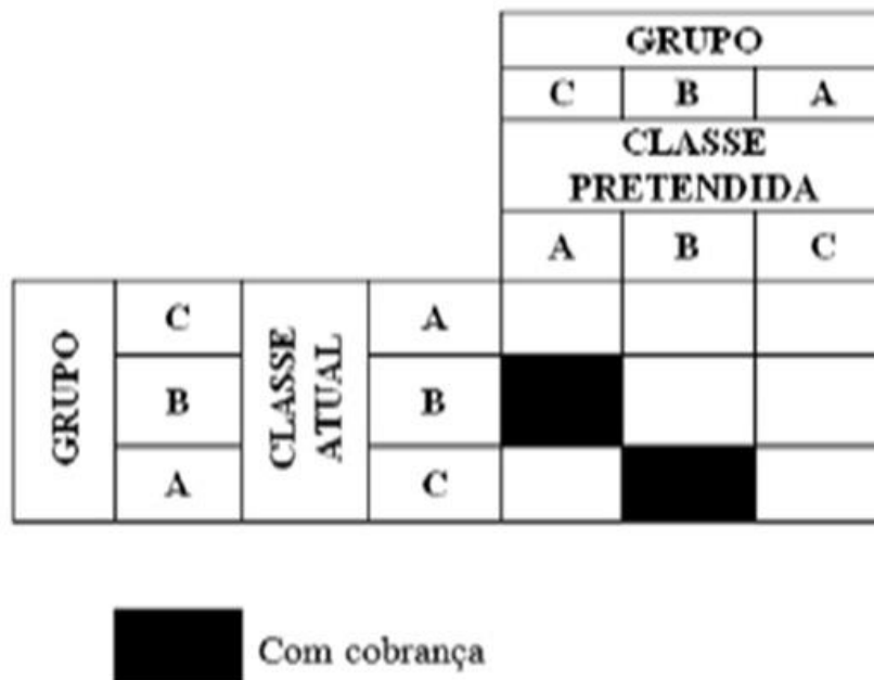
QUADRO 3 - SERVIÇO DE RADIODIFUSÃO SONORA EM ONDA MÉDIA

(retificado pelo DOU de 9 de agosto de 2013)