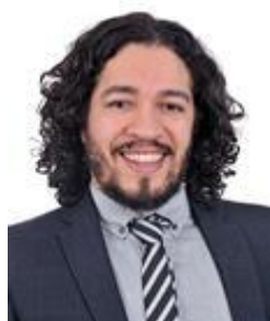
Jean Wyllys PSOL/RJ