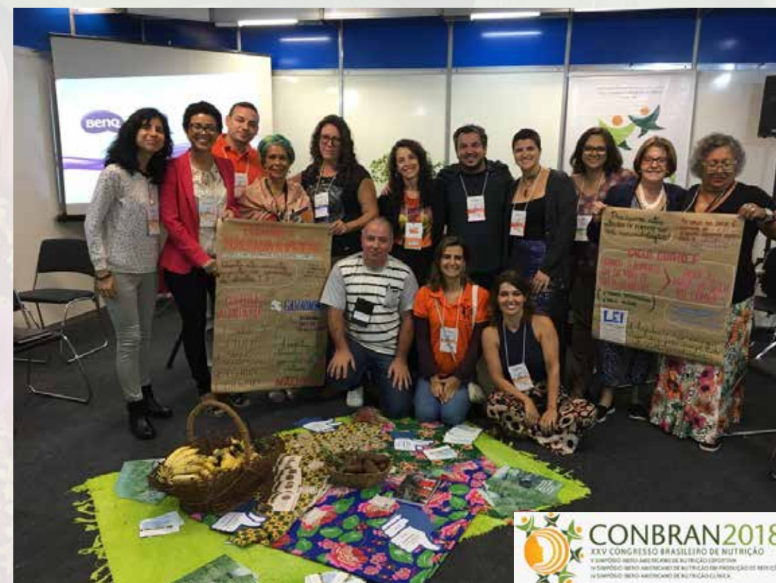
COBRAN 2018 XXV Congresso Nacional de Nutrição