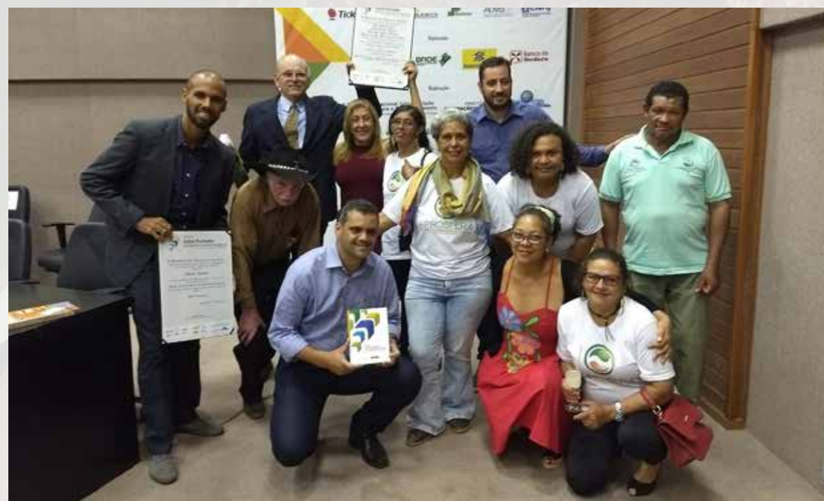
Prêmio Celso Furtado de Desenvolvimento Regional - Ministério da Integração Nacional