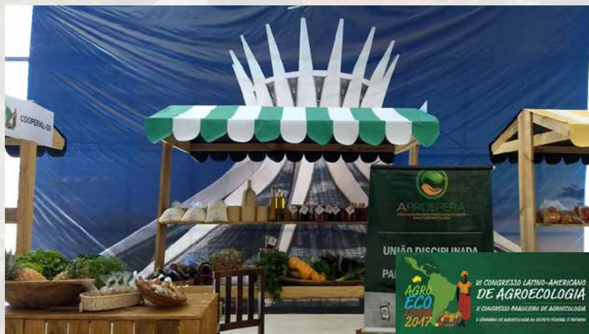
VI Congresso Latino-americano de Agroecologia, o X Congresso Brasileiro de Agroecologia e do V Seminário de Agroecologia do Distrito Federal e Entorno no ano de 2017