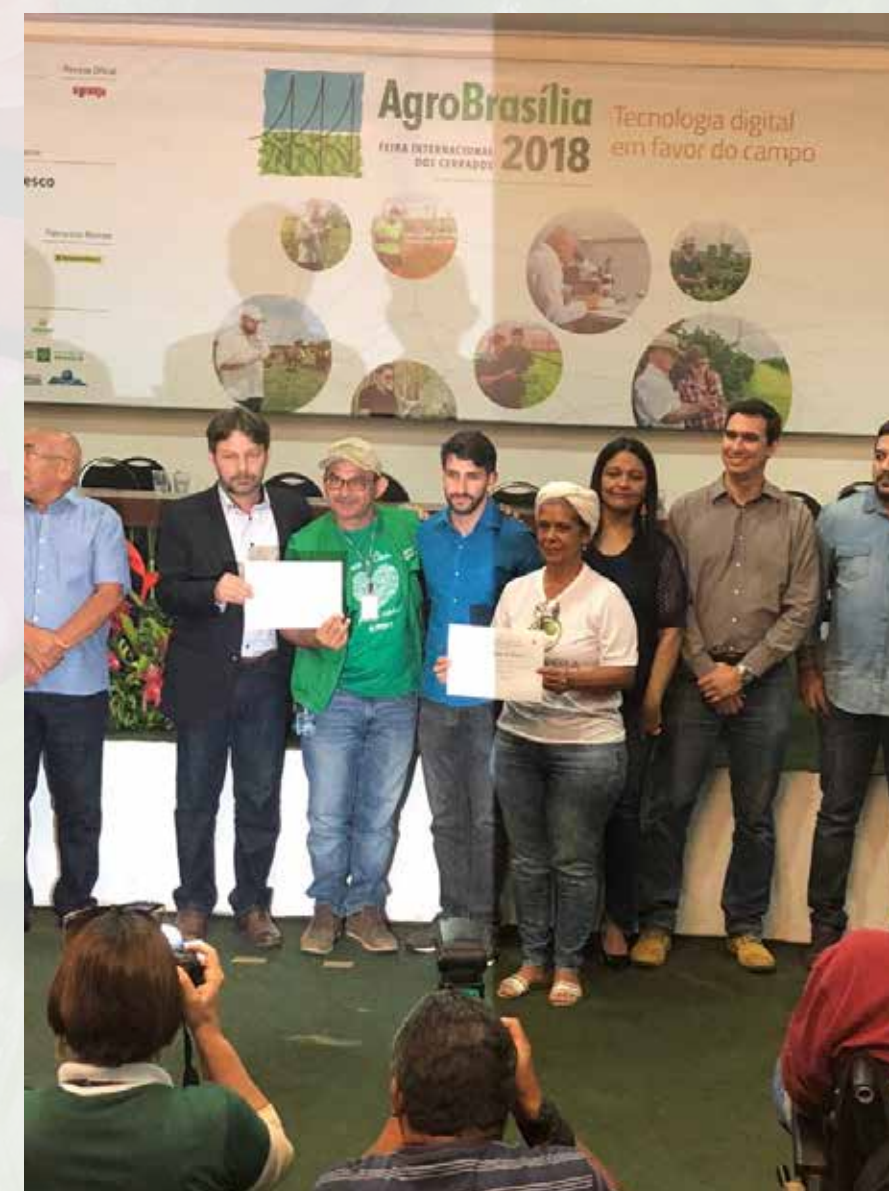
Menção de honra - Agentes transformadores do campo - Sessão solene Câmara Legislativa do DF durante a AGROBRASÍLIA 2018