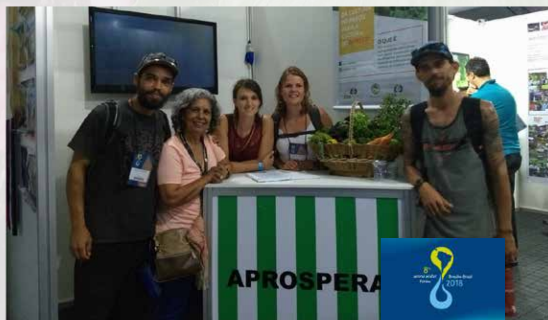
8º Fórum Mundial da Água - 2018 - Mercado de Soluções