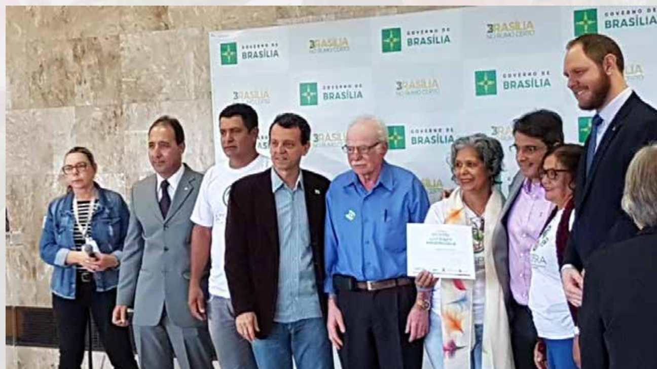
Iniciativas Rurais Sustentáveis - Secretaria do Meio Ambiente