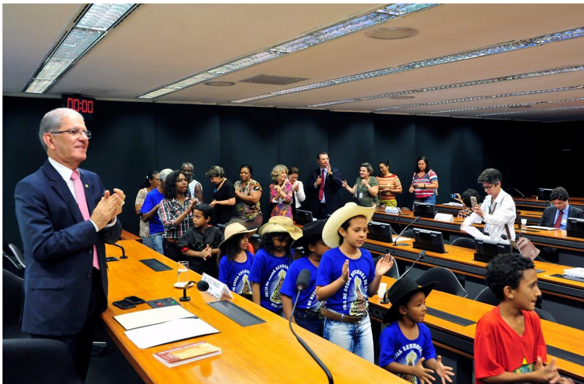
DEP. CHICO D'ÁNGELO Presidente da Comissão de Cultura